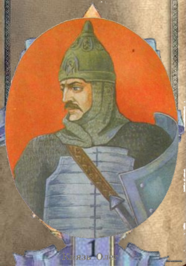
1 Князь Олег