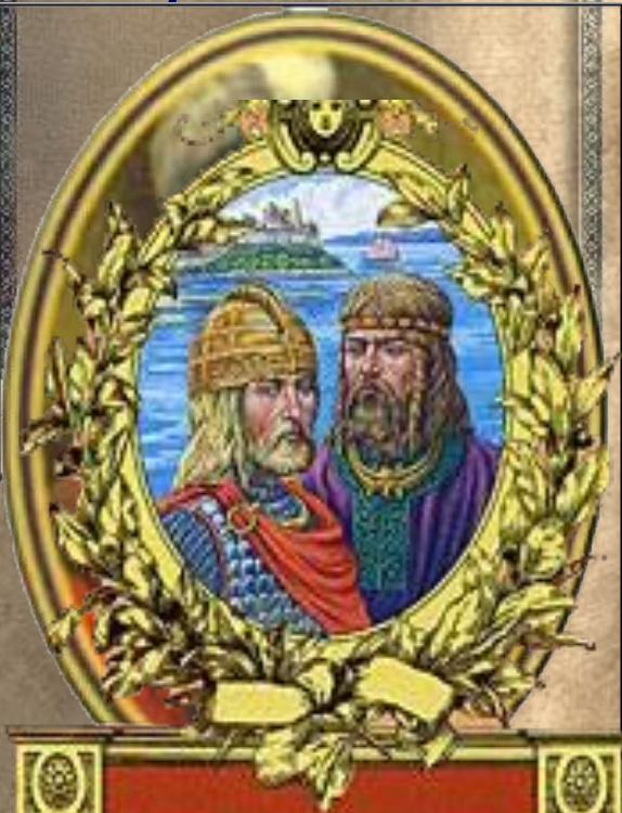
Аскольд и Дир