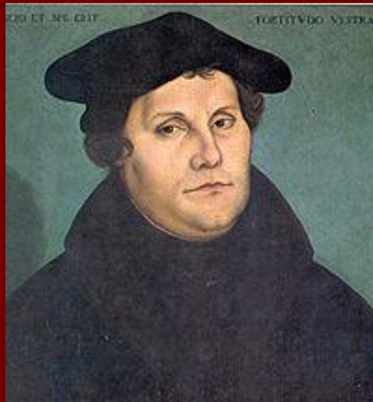
Портрет 1533 г. Худ. Л.Кранах Ст.