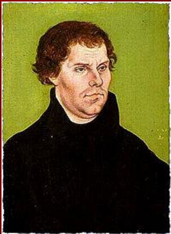
Портрет 1526 г. Худ. Л.Кранах Ст.