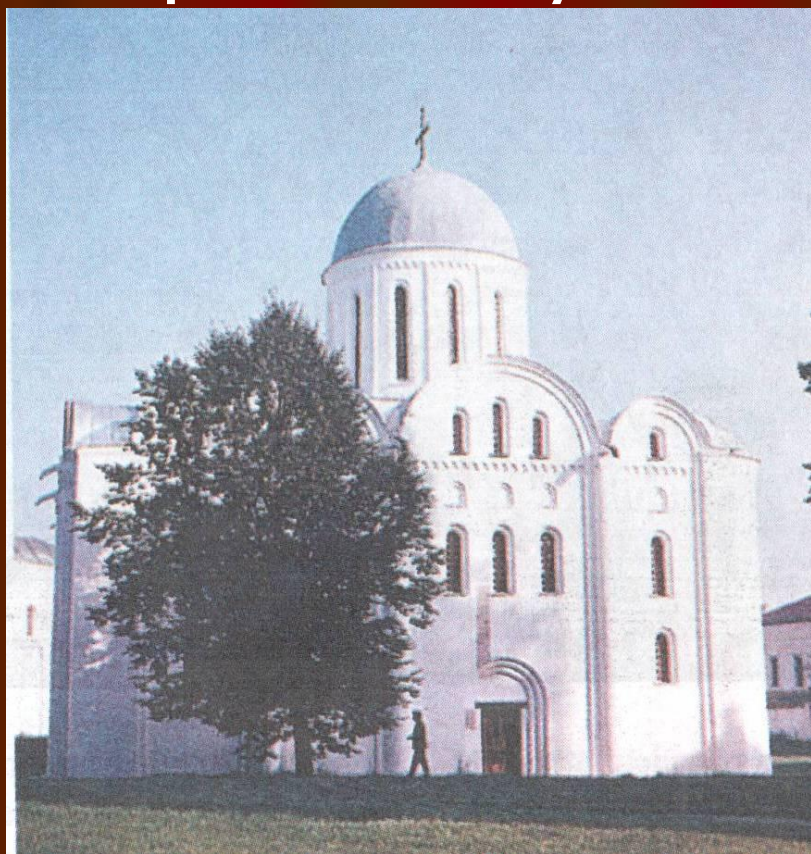
Дмитровский собор во Владимире.