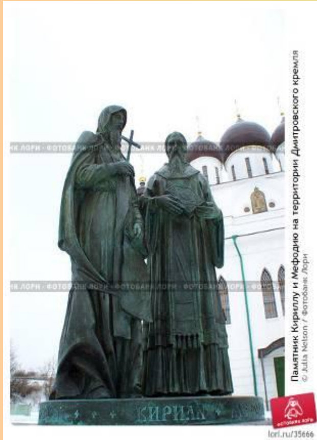
Памятник Кириллу и Мефодию на территории Дмитровского кремля