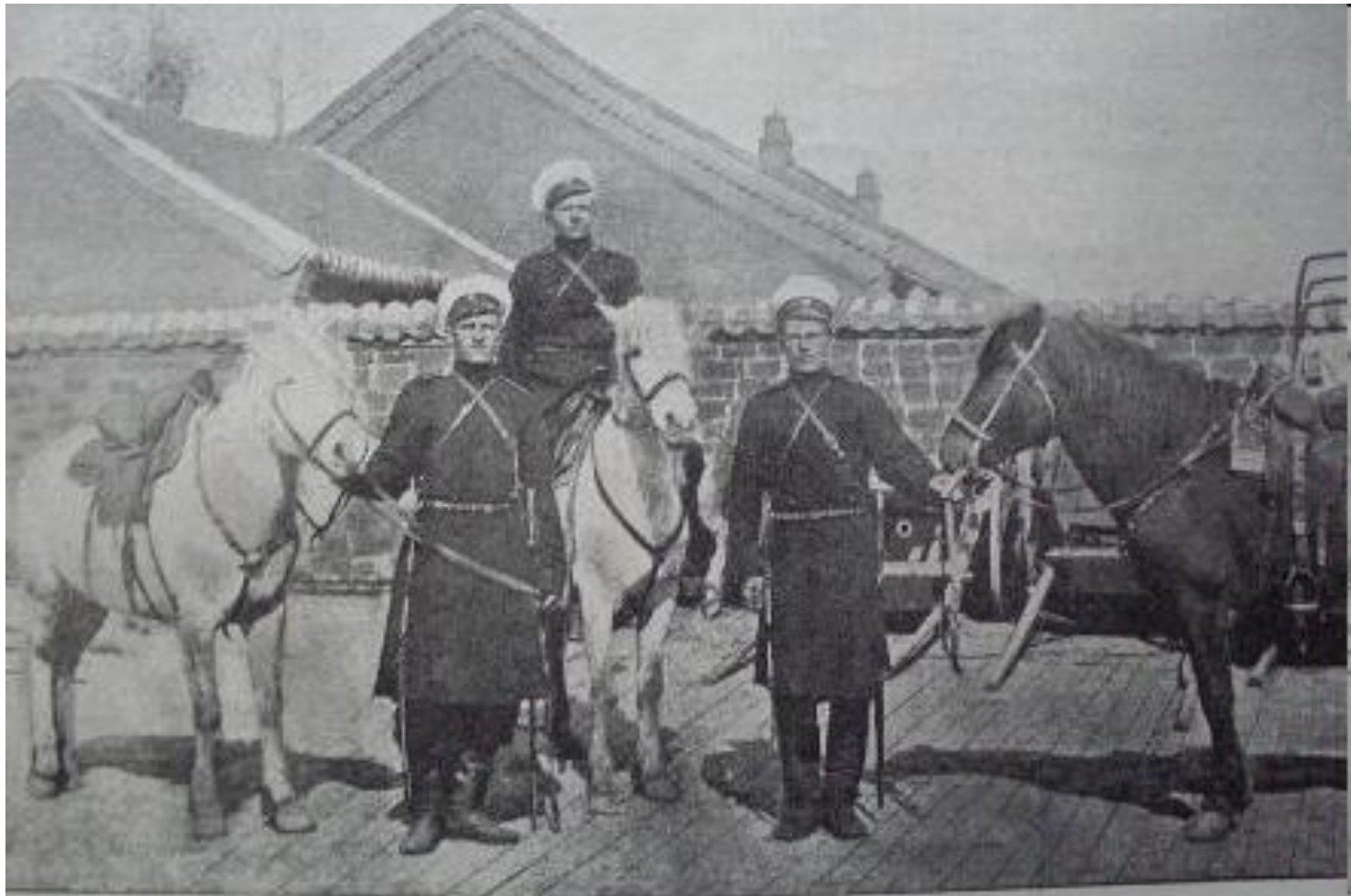
Томск. — Иркутскіе пазани - добровольцы. (Отъ выставки восточнаго народного хозяйства).