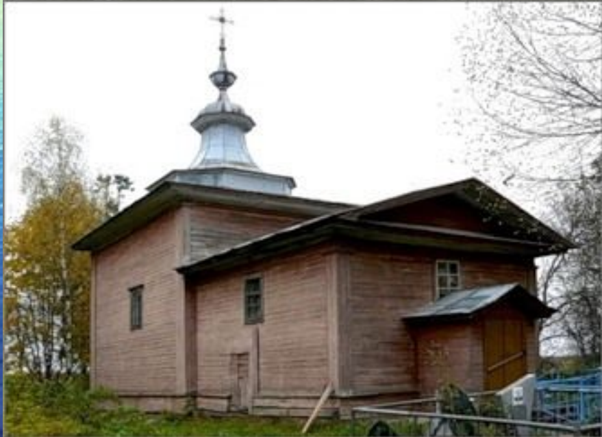
Глушицкий Покровский монастырь, основанный Дионисеем