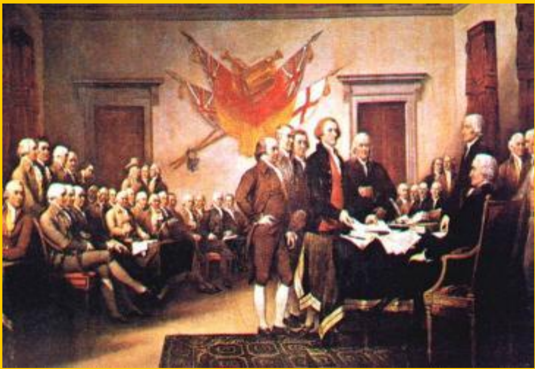
Принятие «Декларации независимости» 4 июля 1776 год