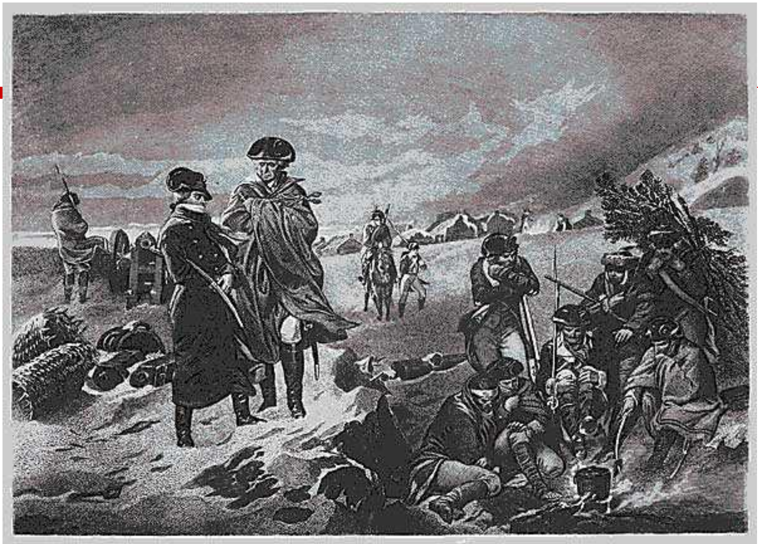
Вашингтон и Лафайет