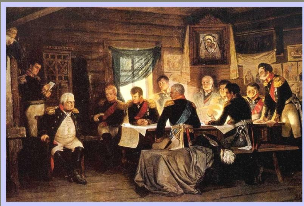
Военный совет в Филлах (1.9.1812)

Александр I и придворные требовали, чтобы под Москвой Кутузов дал сражение. Кутузов подойдя к Москве, собрал военный совет в д.Фили и выслушав всех присутствующих заявил: «С потерей Москвы - не потеряна еще Россия...Но, когда уничтожится армия погибнет Москва и Россия».