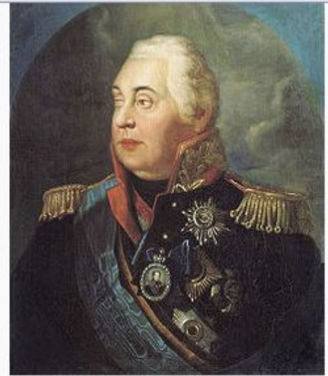
Портрет М. И. Кутузова кисти Р. М. Волкова