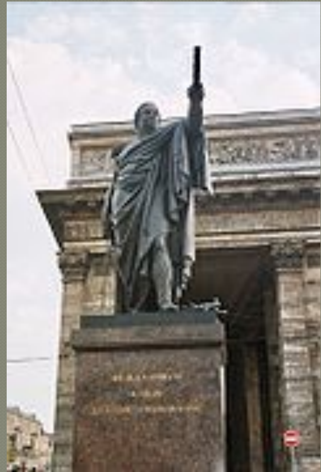
Памятник Кутузову в С.- Петербурге. Скульптор — Б. И. Орловский, литьё — В. П. Екимов, архитектор — К. А. Тон