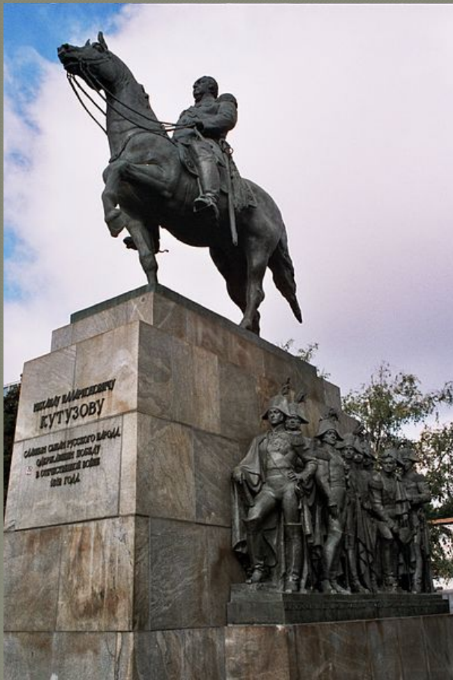
Памятник Кутузову в Москве. Скульптор — Н. В. Томский