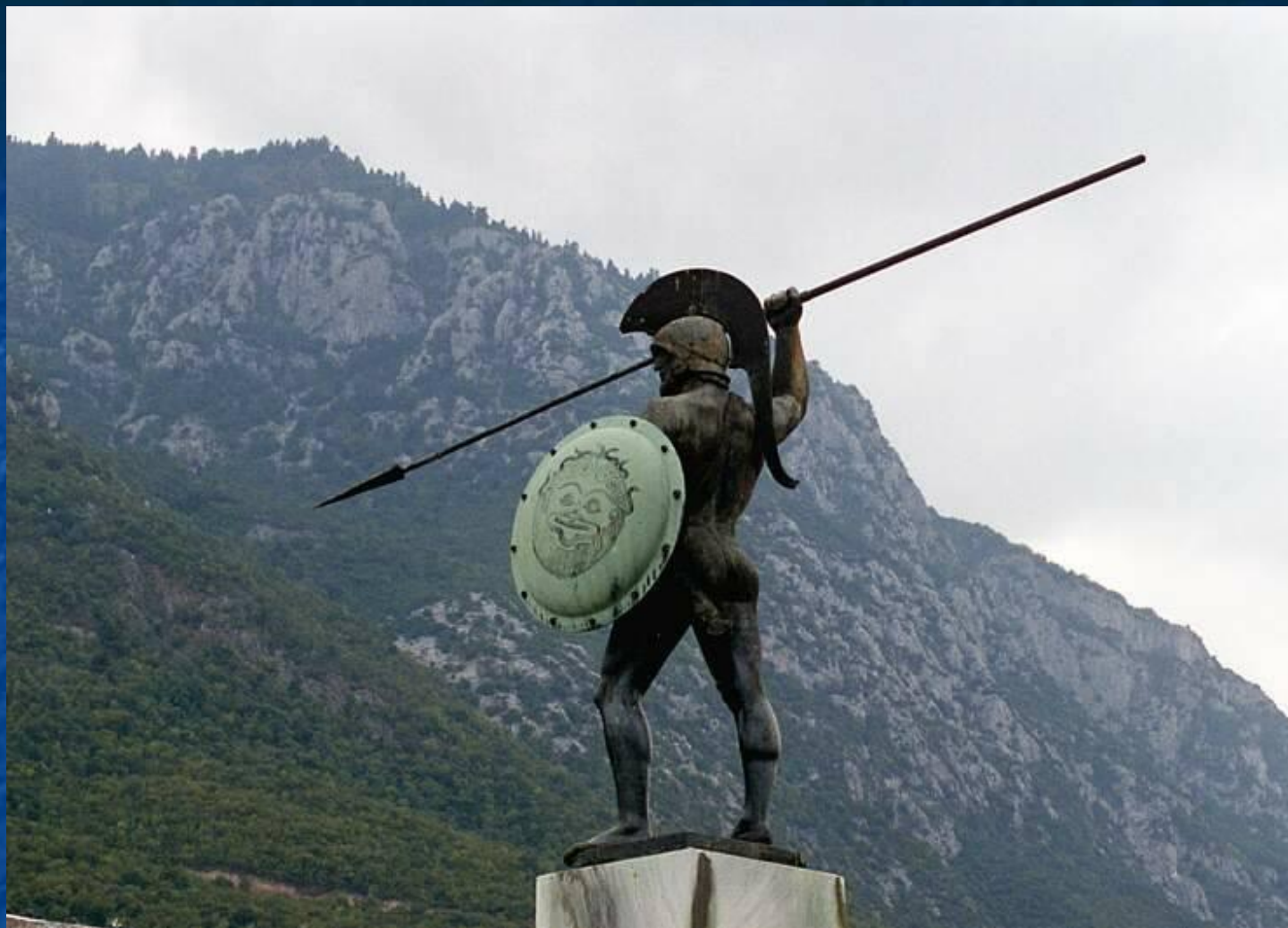
Монумент в честь защитников Фермопил