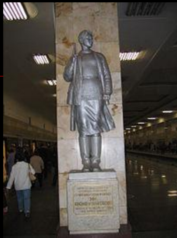
Памятник на ст. м. Партизанская (г. Москва)