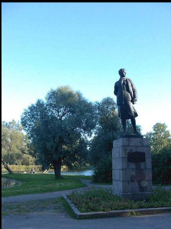
Памятник Зое Космодемьянской