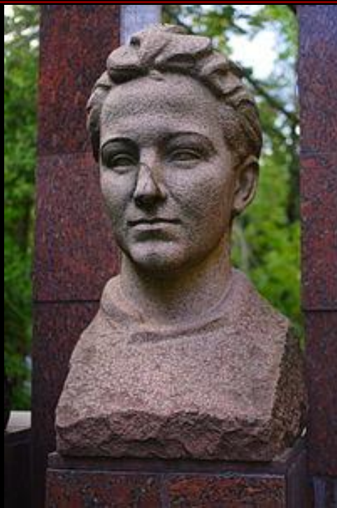
Памятник возле школы № 201 г. Москва