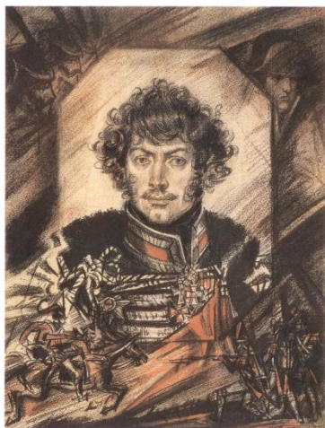
Александр Никитич Сеславин