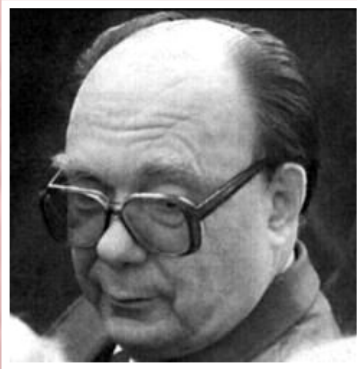
Секретарь ЦК КПСС по идеологии А.Н.Яковлев.

Гласность привела к переосмыслению прошлого. В печати были подняты «закрытые» прежде темы, критике подверглись ближайшие соратники Ленина.