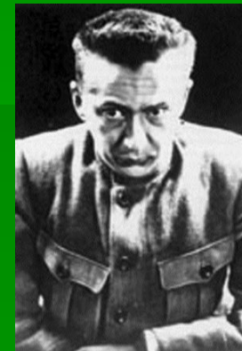
А. Ф. Керенский