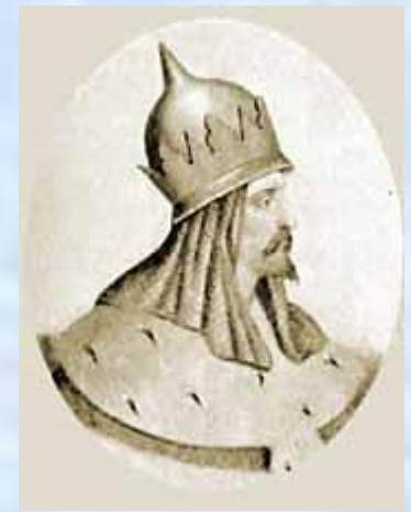
Мстислав Романович, погиб в битве на Калке

Южные русские князья откликнулись на просьбу половцев и приняли участие в 1223 г. в битве на р. Калке