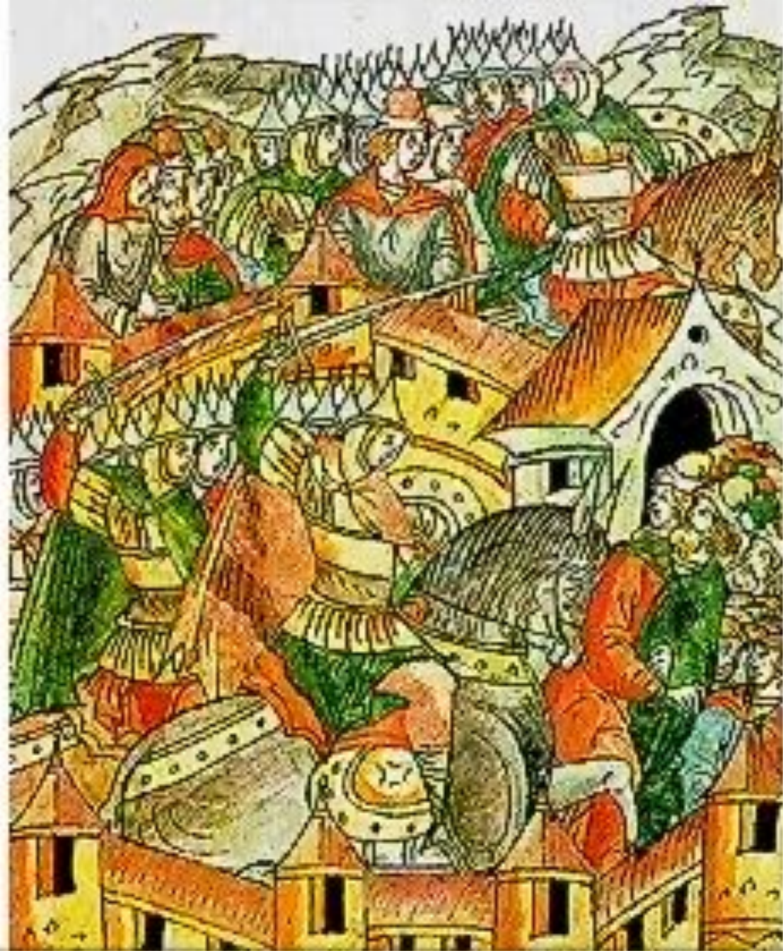
Взятие и разорение ордынцами Москвы 1238 г.