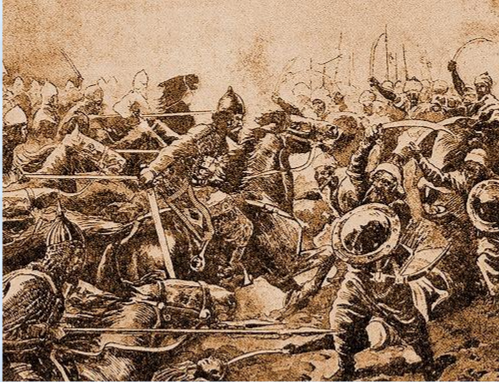
Битва Галицкого войска с монголами

«Русь спасла Европу от МОНГОЛЬСКОГО нашествия»