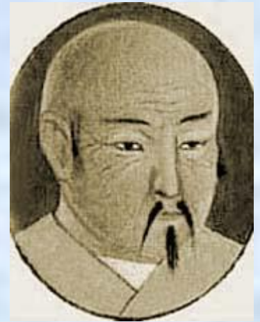
Хан Батый ( Бату- хан)