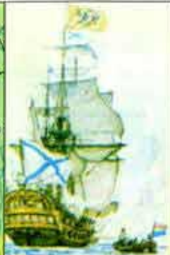
Военный корабль. XVIII век