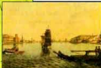
Петербург начала XVIII в. Худ. Е. Лансере