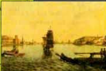
Петербург начала XVIII в. Худ. Е. Лансере