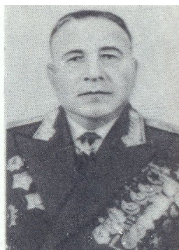
КОМАНДУЮЩИЙ ПЕРВОЙ ГВАРДЕЙСКОЙ ТАНКОВОЙ АРМИЕЙ М.Е. КАТУКОВ