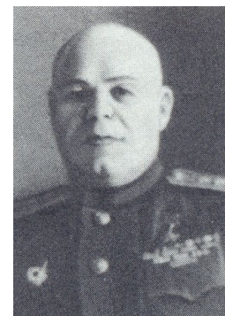
КОМАНДУЮЩИЙ ТРЕТЬЕЙ ГВАРДЕЙСКОЙ ТАНКОВОЙ АРМИЕЙ П.С. РЫБАЛКО