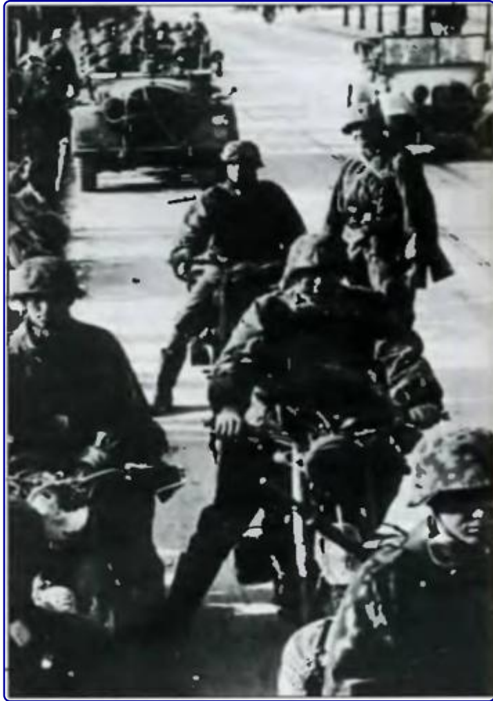
Немецкие мотоциклисты на улицах Белграда