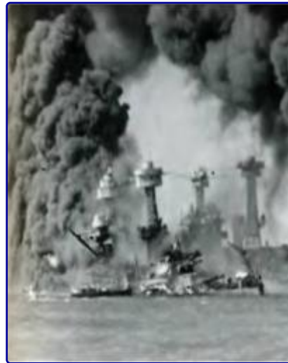
7 декабря 1941 года. После нападения на Пёрл-Харбор