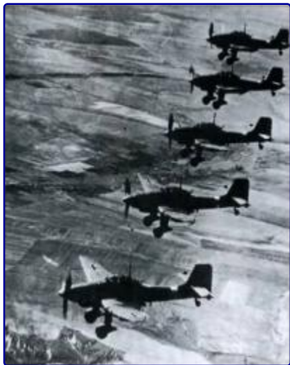
22 июня 1941 года. Немецкие бомбардировщики над советской территорией