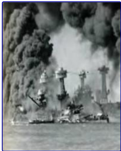
7 декабря 1941 года. После нападения на Пёрл-Харбор