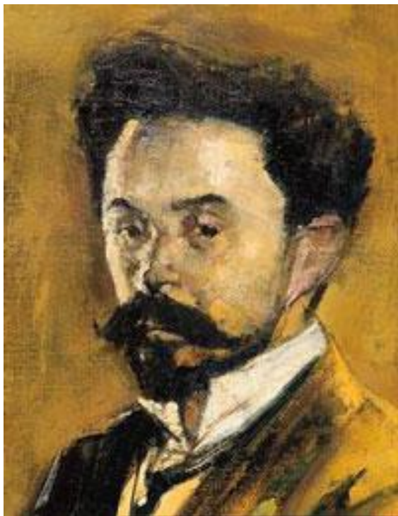
Александр Николаевич Скрябин