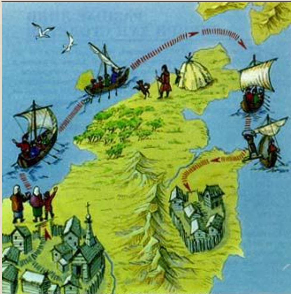
Путешествие Семена Дежнева

Впервые пройдя проливом отделяющим Америку от Азии, Дежнев основал Анадырский острог. В 1649-53 гг. в результате походов Е. Хабарова были составлены подробные карты Амура. Нерчинский договор 1689 г. установил границы между Россией и Китаем.