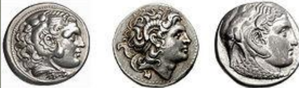
Портреты Александра Великого на монетах, выпущенные после его смерти

Александр Македонский на античных монетах чаще всего изображался с головным убором Геракла (головой льва) или рогами бога Аммона