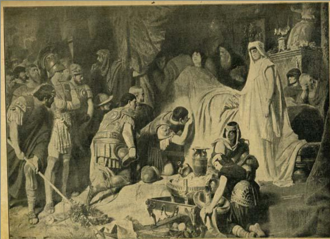
Александр Македонский прощается перед смертью со своими войнами.