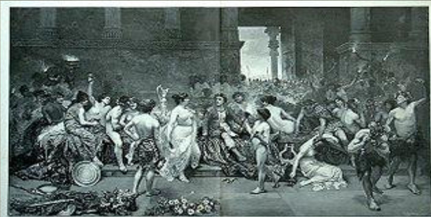
G. Simonis. Scene with Alexander and his Hetaerae. Engraving by H. Ponceau on steel.