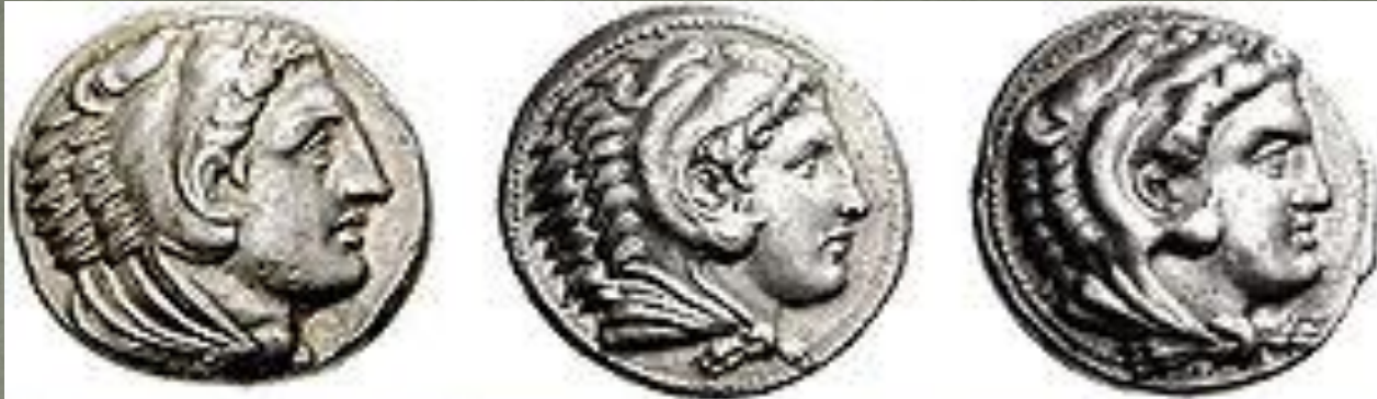
Портреты Александра Великого на монетах, выпущенные при его жизни