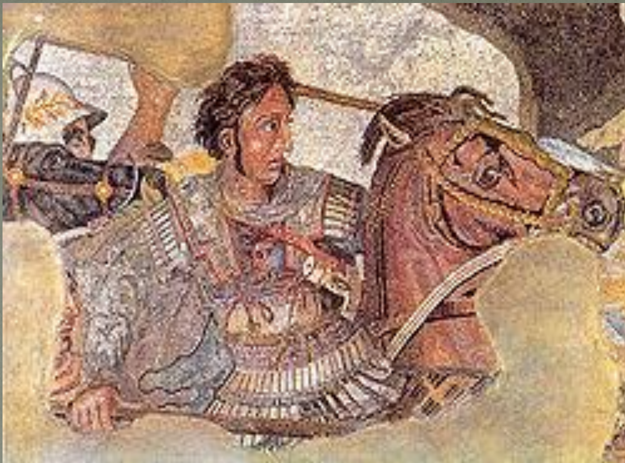
Александр Македонский на фрагменте древнеримской мозаики из Помпей, копия с древнегреческой картины