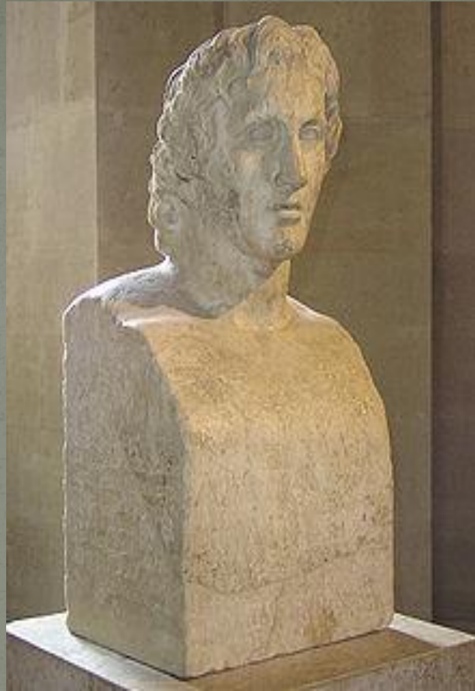
Римская копия с работы Лисиппа. Одна из наиболее достоверных работ по внешности Александра (музей Лувра)