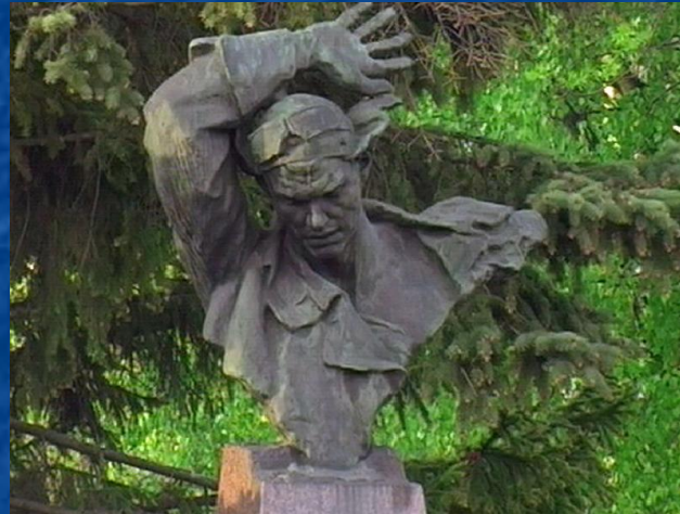
Памятник Н.Ф. Гастелло в городе Муроме