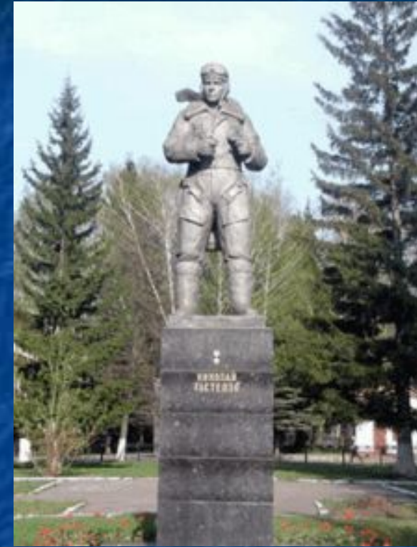
Памятник Н. Ф. Гастелло в сквере около вечернего факультета Уфимского авиационного университета