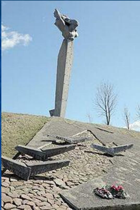
Памятник экипажу Н. Ф. Гастелло на месте гибели бомбардировщика А. С. Маслова