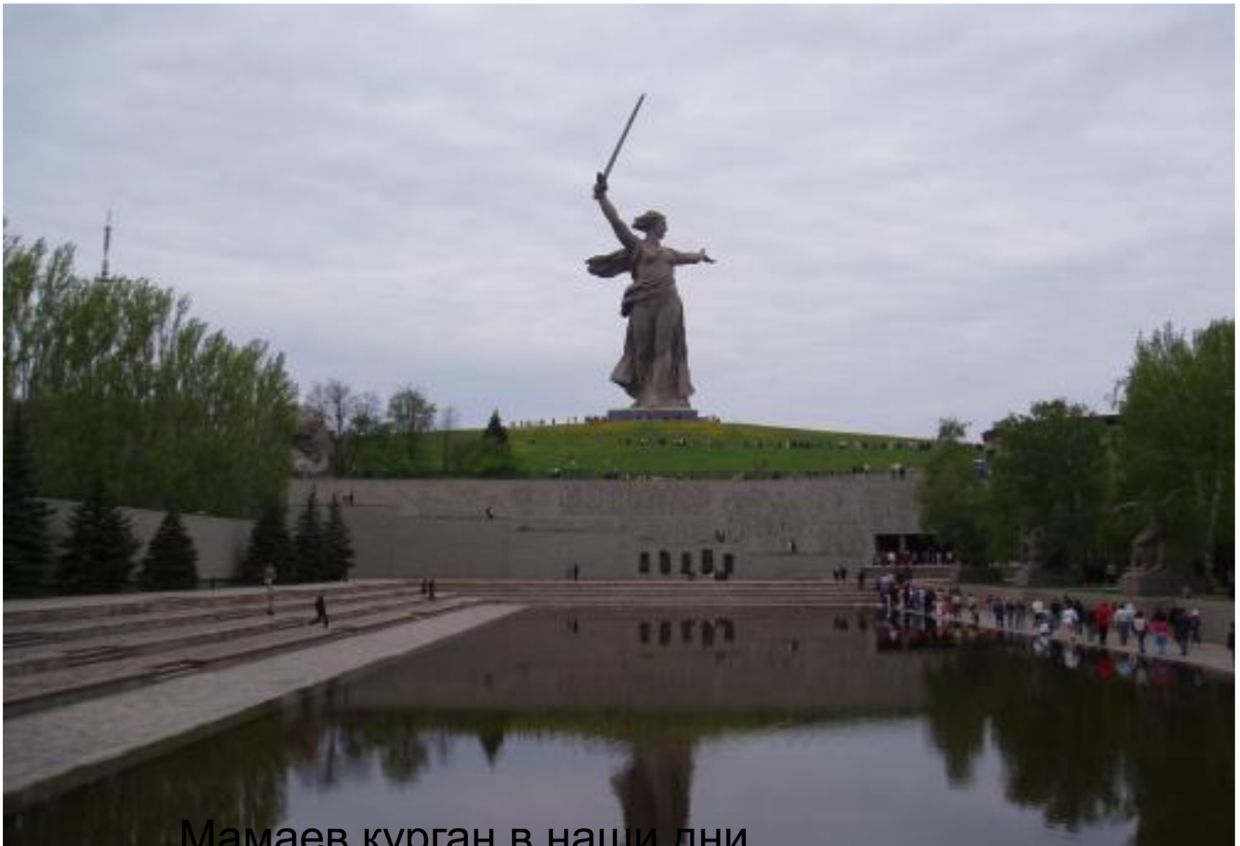
Мамаев курган в наши дни