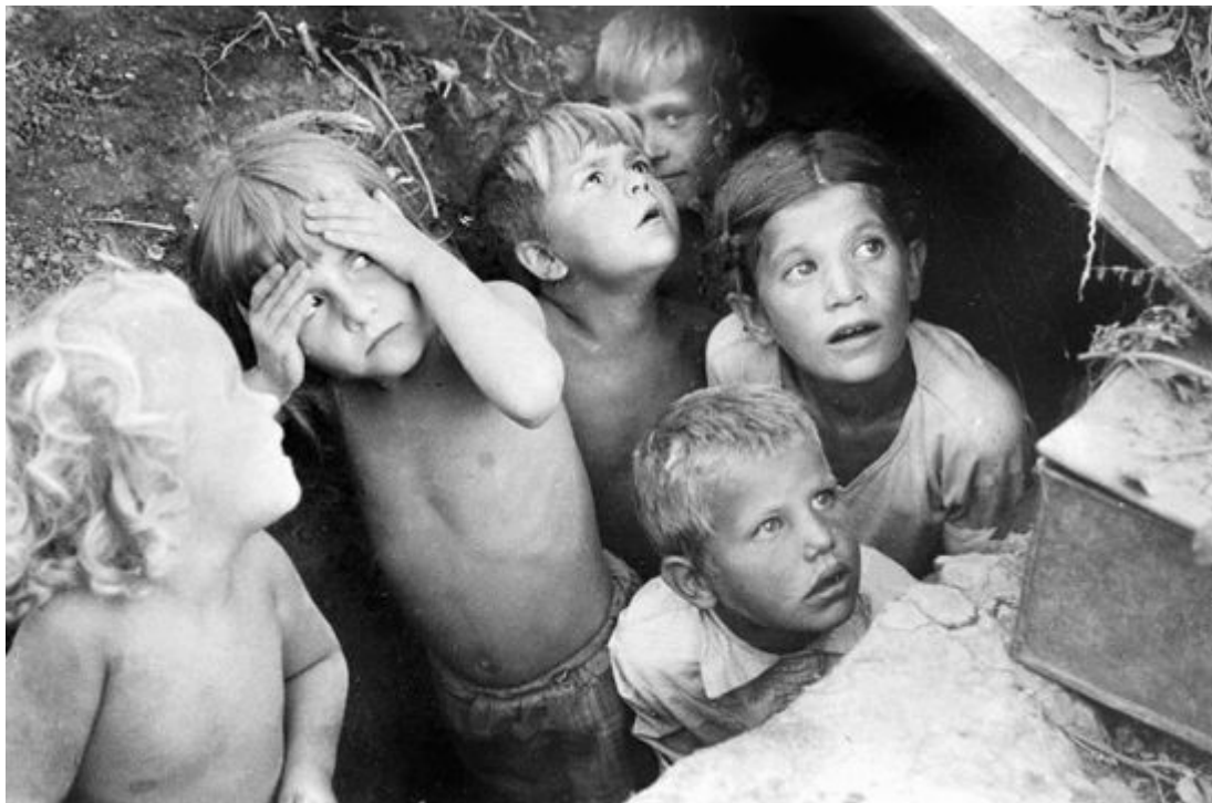
Дети прячутся от бомбежки в щели. 1941 год.

В 4 часа утра 22 июня 1941 года войска фашистской Германии (5,5 миллионов человек) перешли границы Советского Союза, немецкие самолеты (5 тысяч) начали бомбить со города, воинские