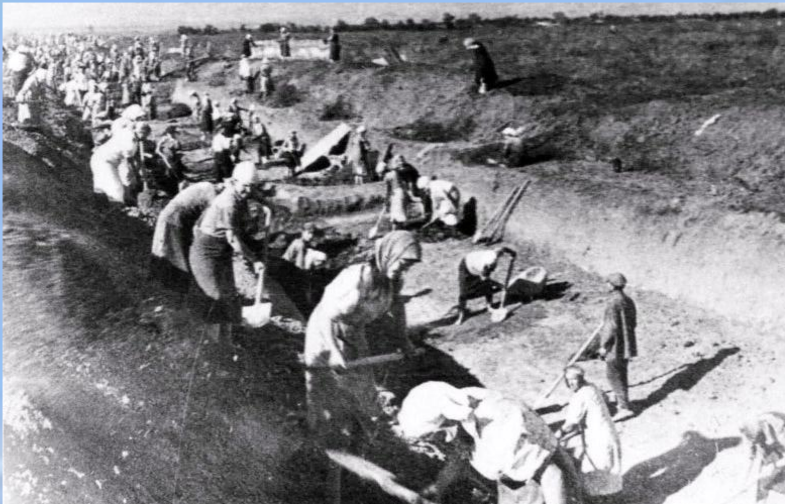
Мирные жители на строительстве противотанковых рвов.