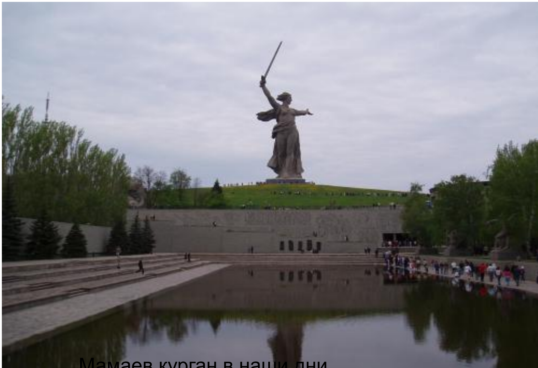
Мамаев курган в наши дни