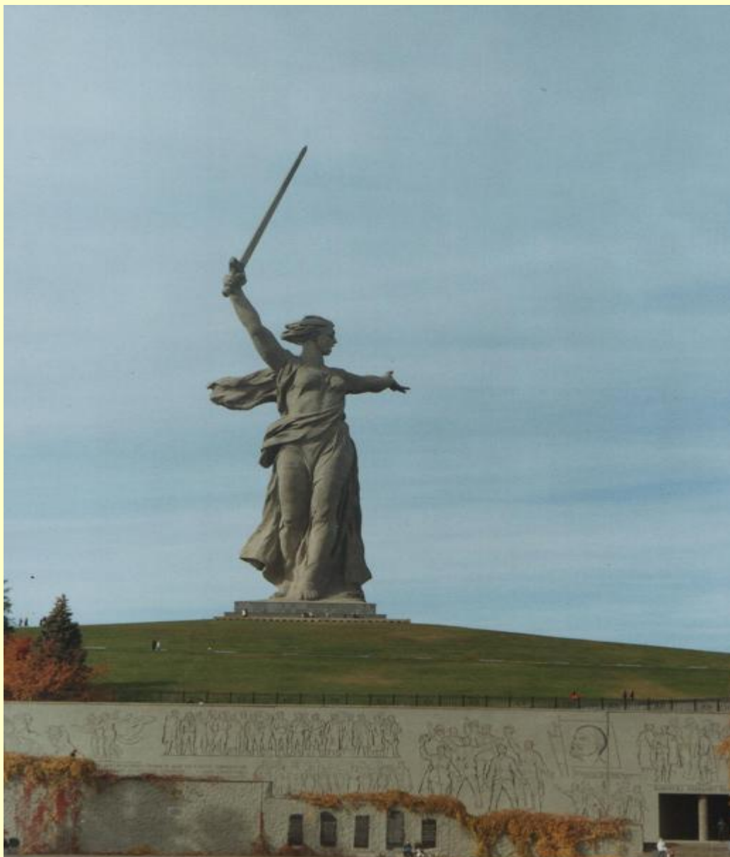
Мамаев курган в наши дни