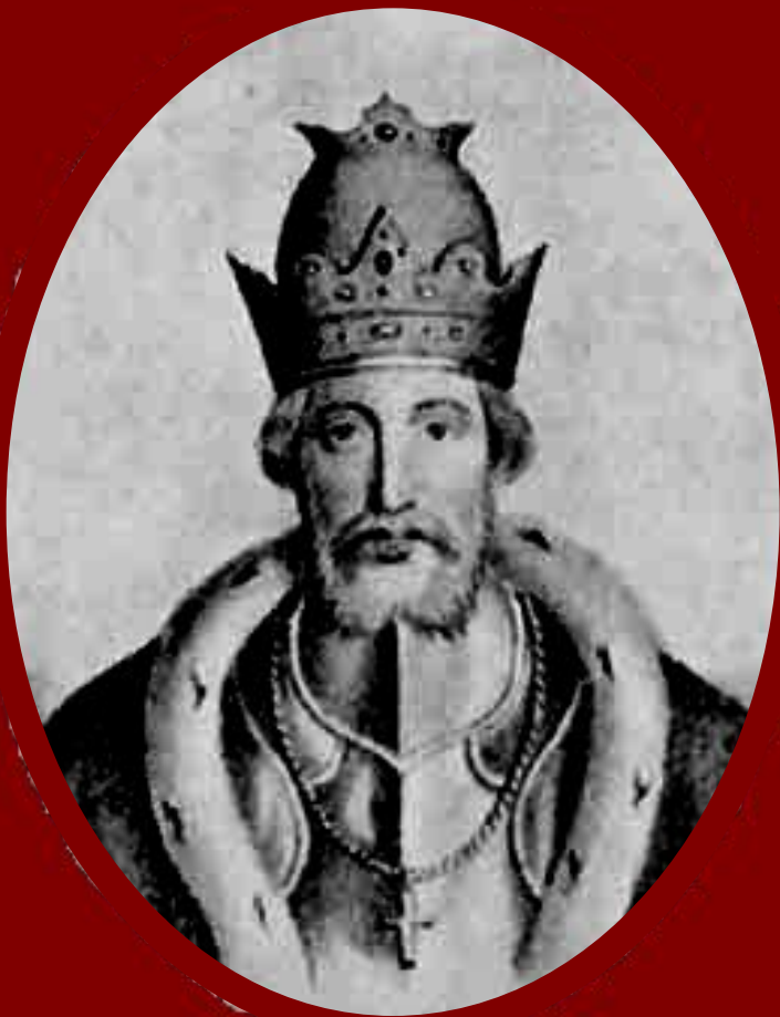
Юрий Данилович Московский