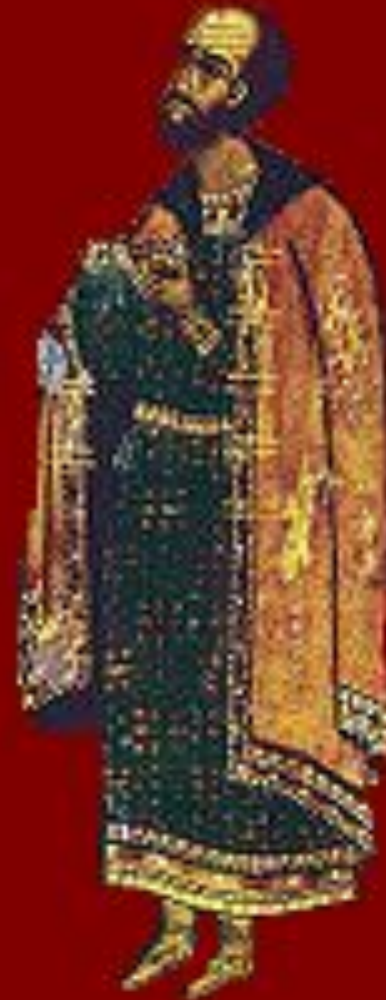
Михаил Ярославич Тверской