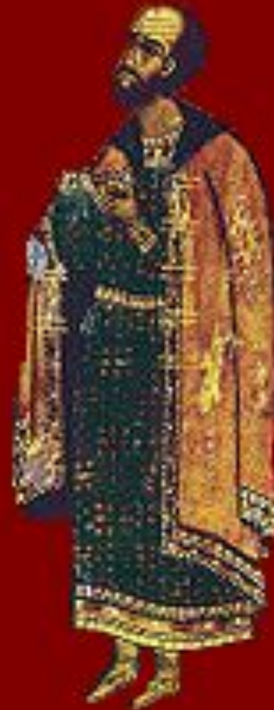
Михаил Ярославич Тверской