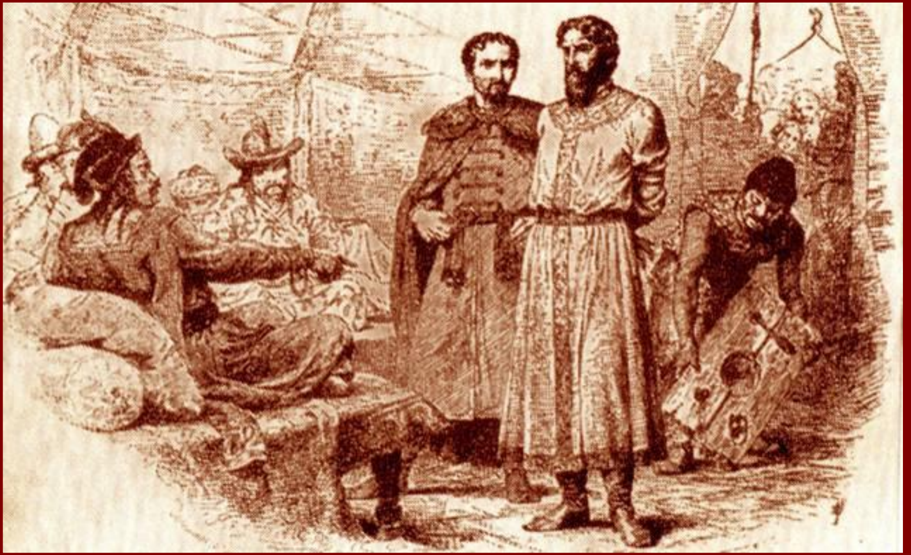
Михаил Ярославич у хана Узбека