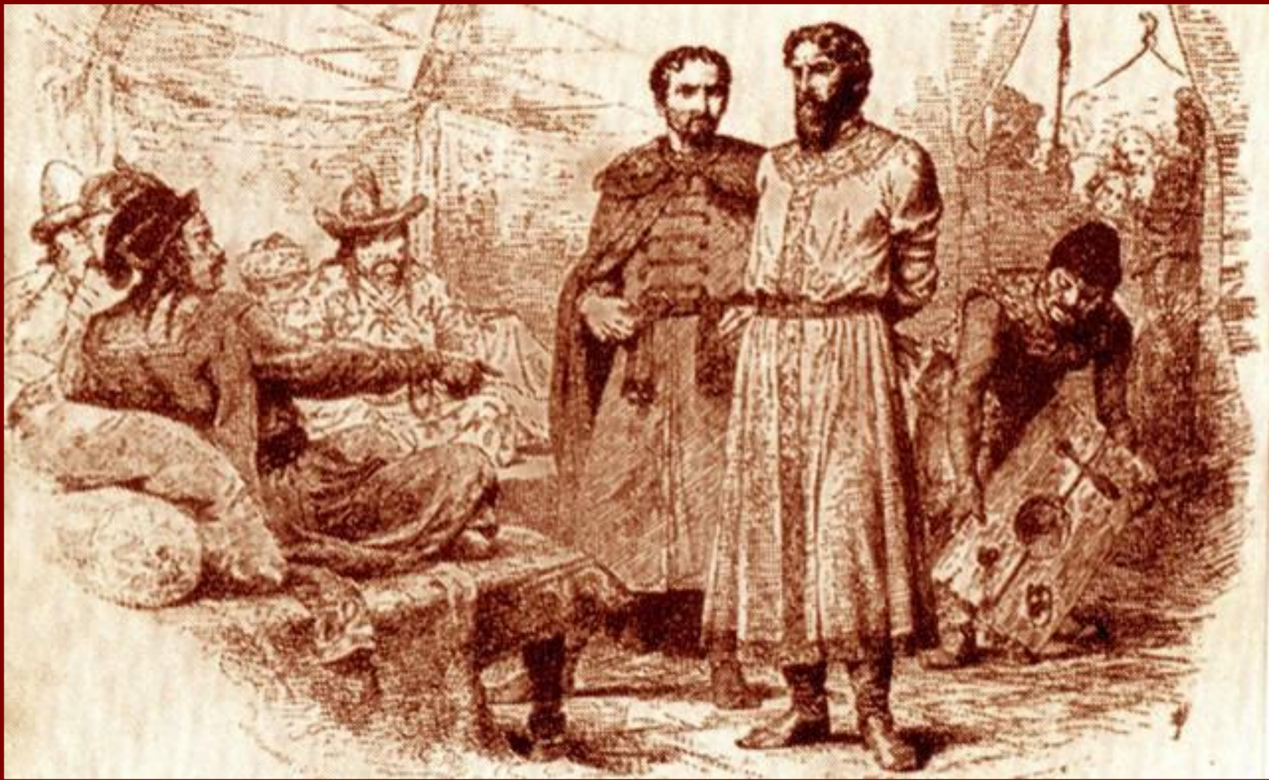
Михаил Ярославич у хана Узбека