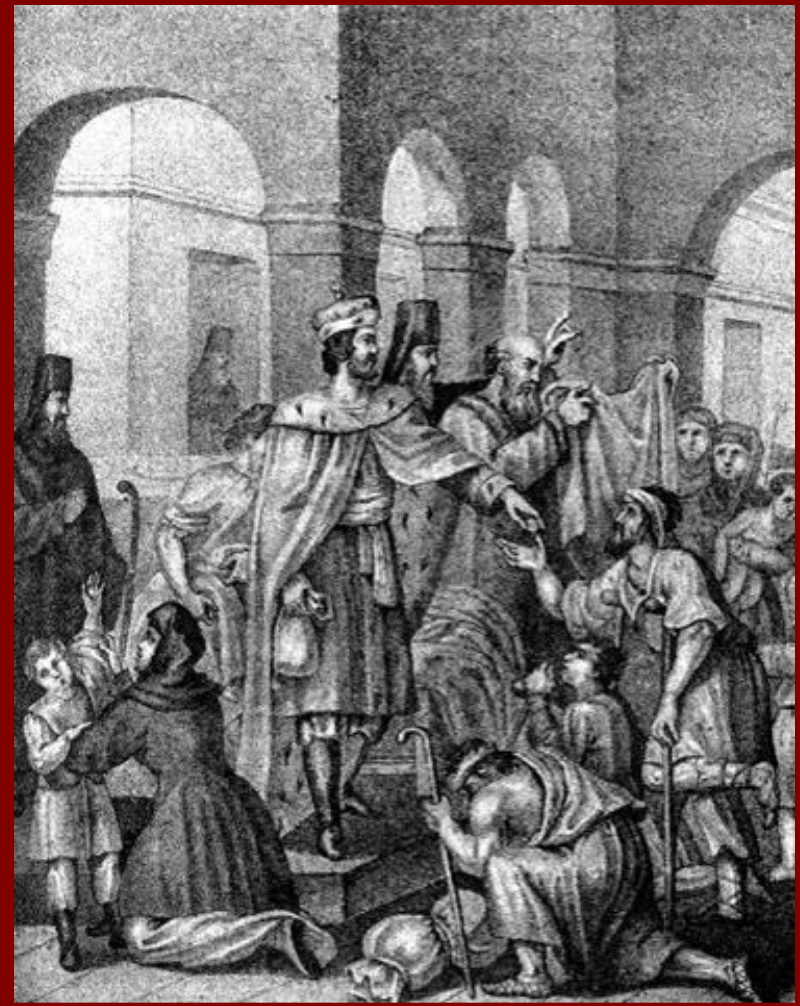
Иван Данилович Калита