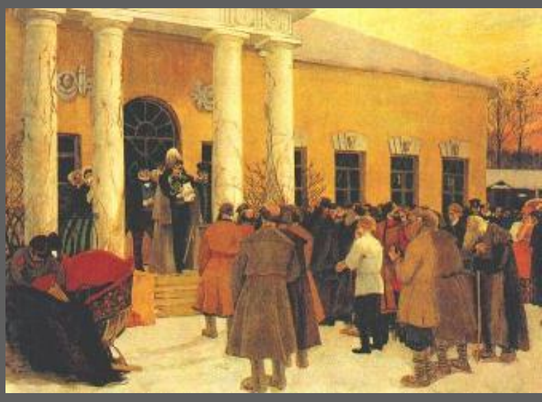
Б.Кустодиев Освобождение крестьян

Размер выкупа должен был сохранить доход помещика от оброка. Он равнялся сумме, которая будучи положенной в банк при 6% годовых, давала доход равный оброку. Крестьянин платил 20%, остальное вносило государство, давая крестьянам ссуду на 49 лет, при этом расчет велся не с крестьянином, а с общиной.