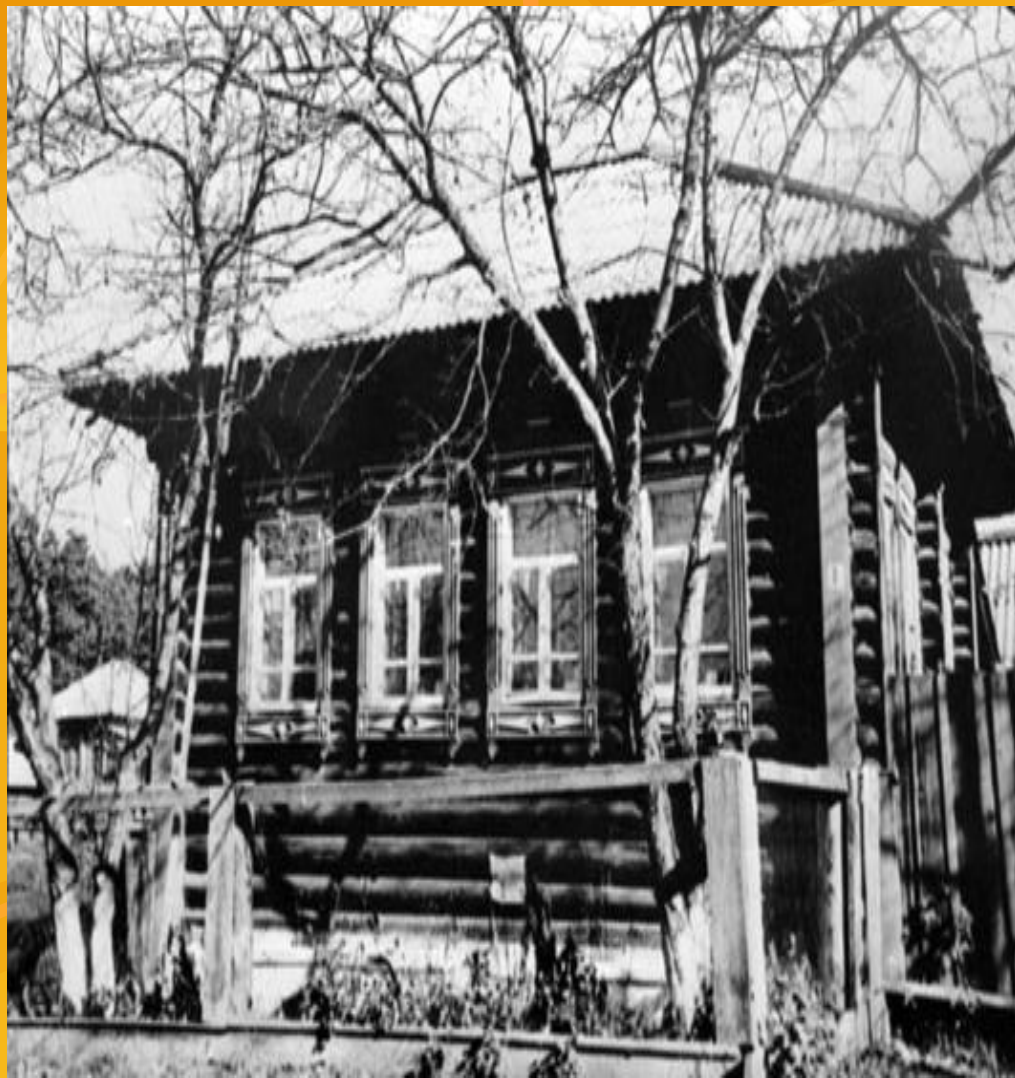
Дом Ельциных в Бутке