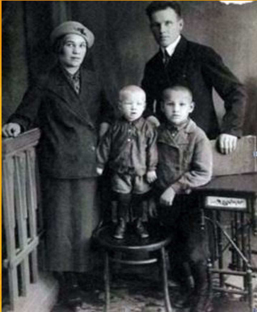
Из семейного альбома. С родителями и младшим братом в Березняках