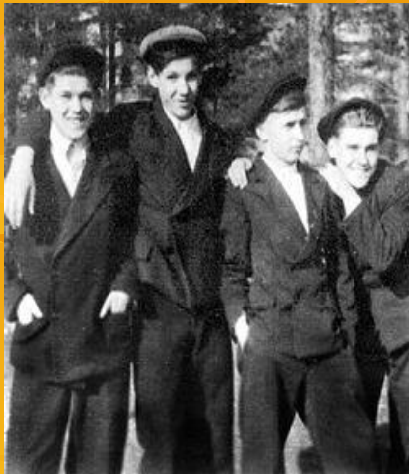
Борис Ельцин (второй слева) с друзьями детства

В школе Ельцин выделялся среди сверстников своей активностью. С первого класса его избирали старостой. Ельцин учился успешно, но отличался дерзким и своенравным поведением, конфликтовал с учителями, за что после седьмого класса был исключен из школы. Вскоре он, однако, был восстановлен и окончил школу с отличными отметками по большинству предметов.