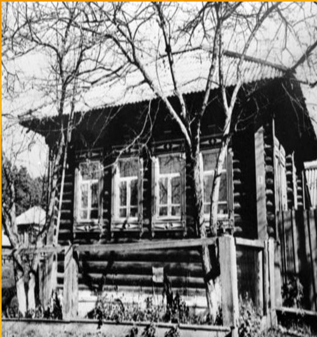
Дом Ельциных в Бутке