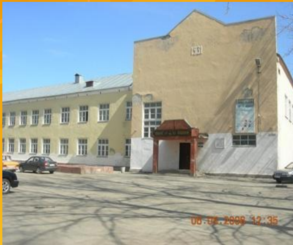
Школа в Березняках