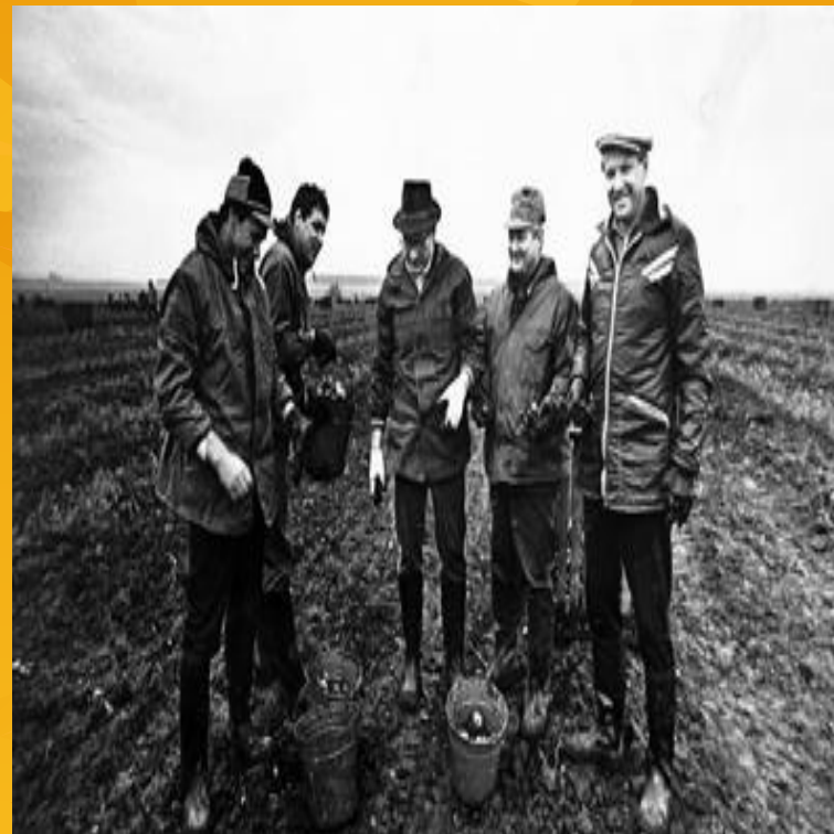
На субботнике по уборке картофеля, 1980 год.