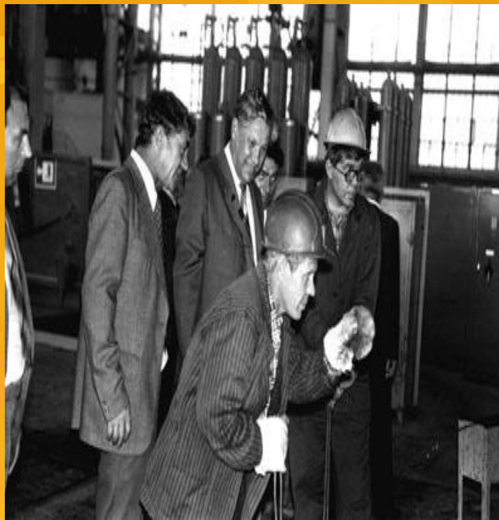
Встреча с трубниками Первоуральска

Профессиональные достижения и организаторский талант привлекли к Б. Н. Ельцину внимание партийных органов. Во второй половине 60-х годов начинается его жизнь в политике. Почти двадцать лет напряженной руководящей работы связывают Б. Н. Ельцина со Свердловском, причем почти 10 из них он стоял во главе областной партийной организации Свердловской области.