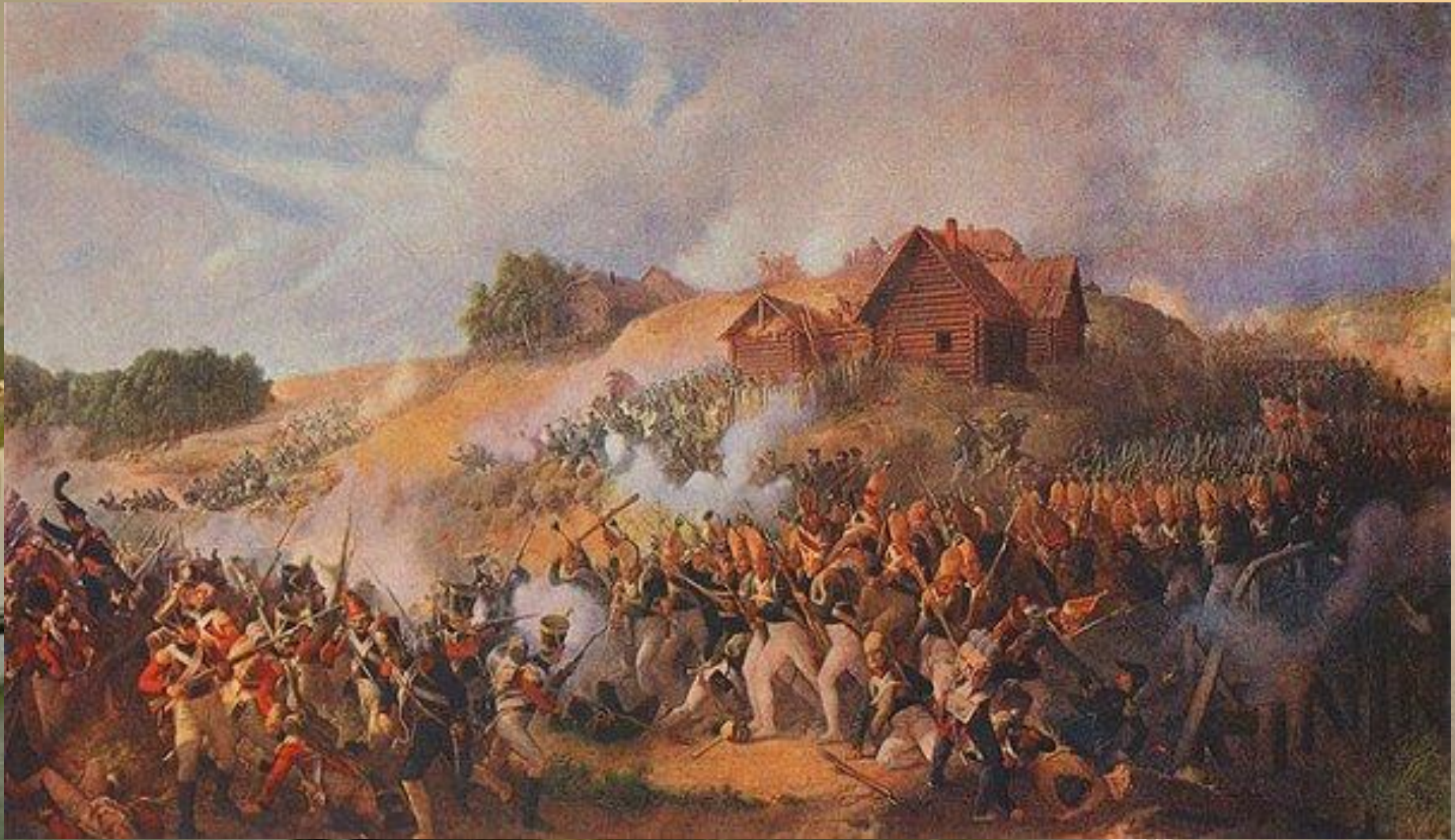
Фото П.Гесс Сражение при Клястицах 19 июля 1812 года