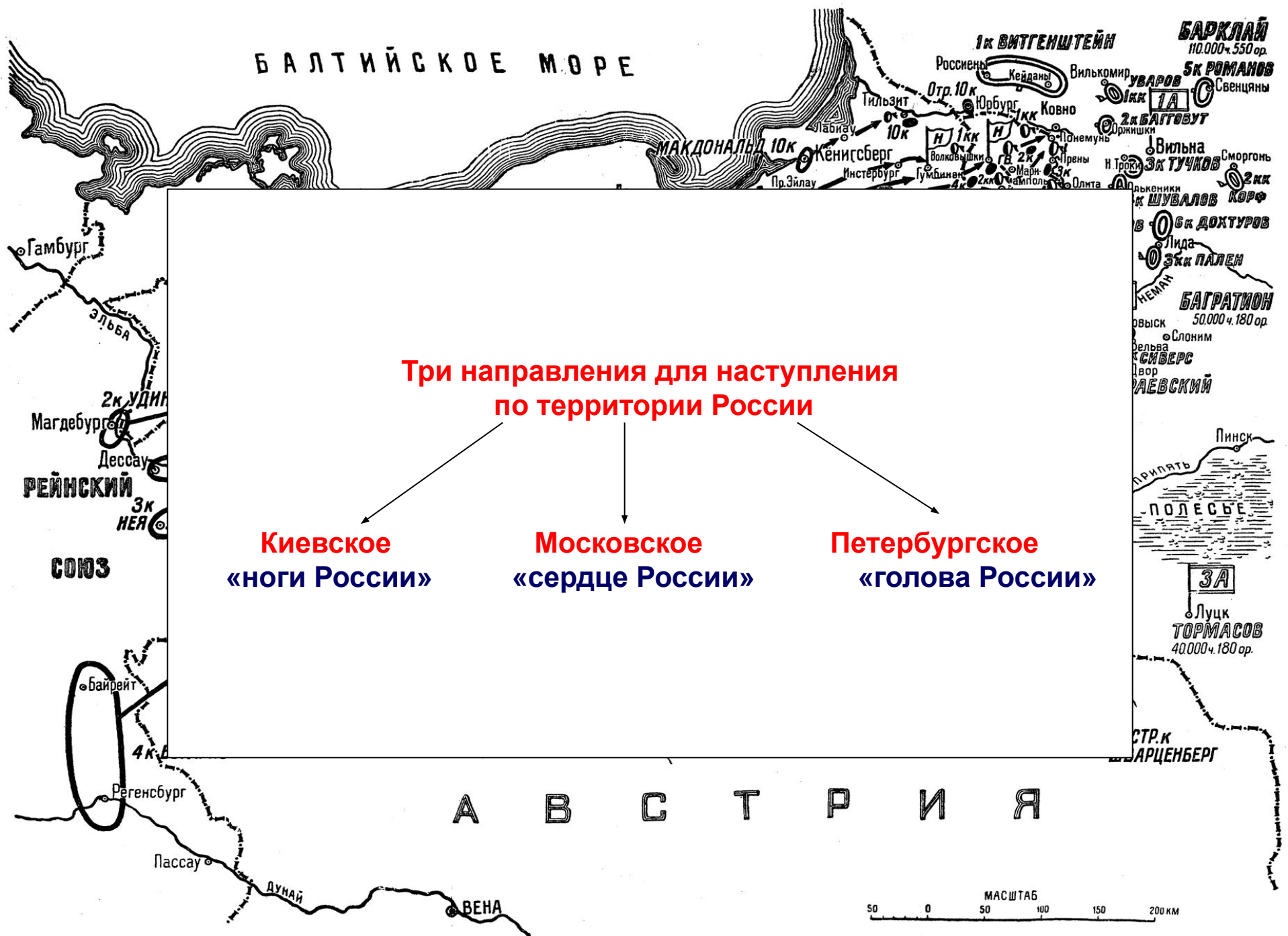
Схема 34. Начало похода Наполеона в Россию в 1812 г.