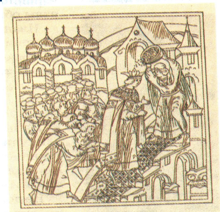
Обряд осыпания золотыми монетами царя Ивана IV после венчания на царство. Миниатюра.