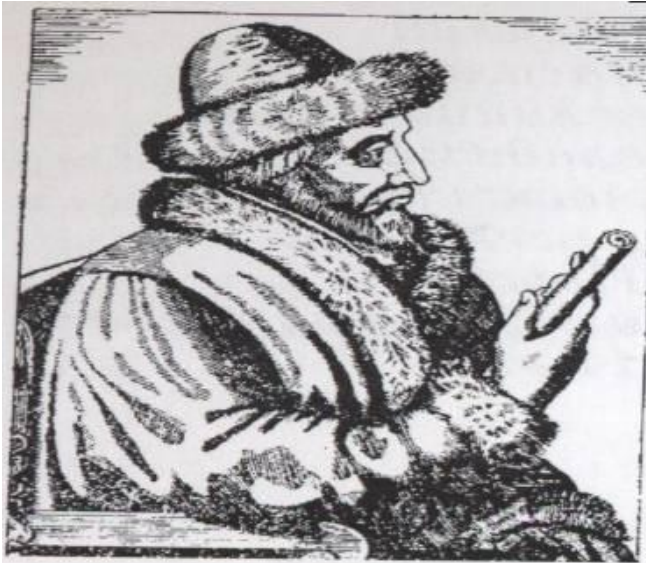
Василий III. С немецкой гравюры 16 в.