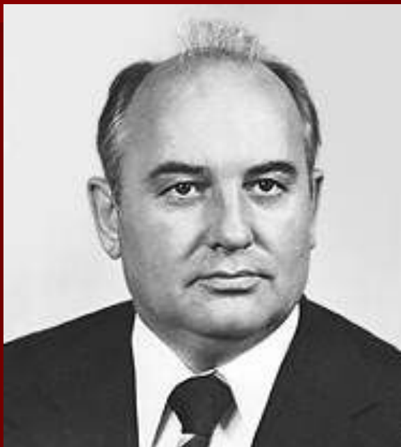
Президент СССР Горбачев М.С.