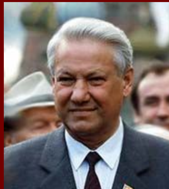
Первый президент России Ельцин Б.С.