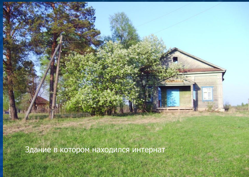
Здание в котором находился интернат