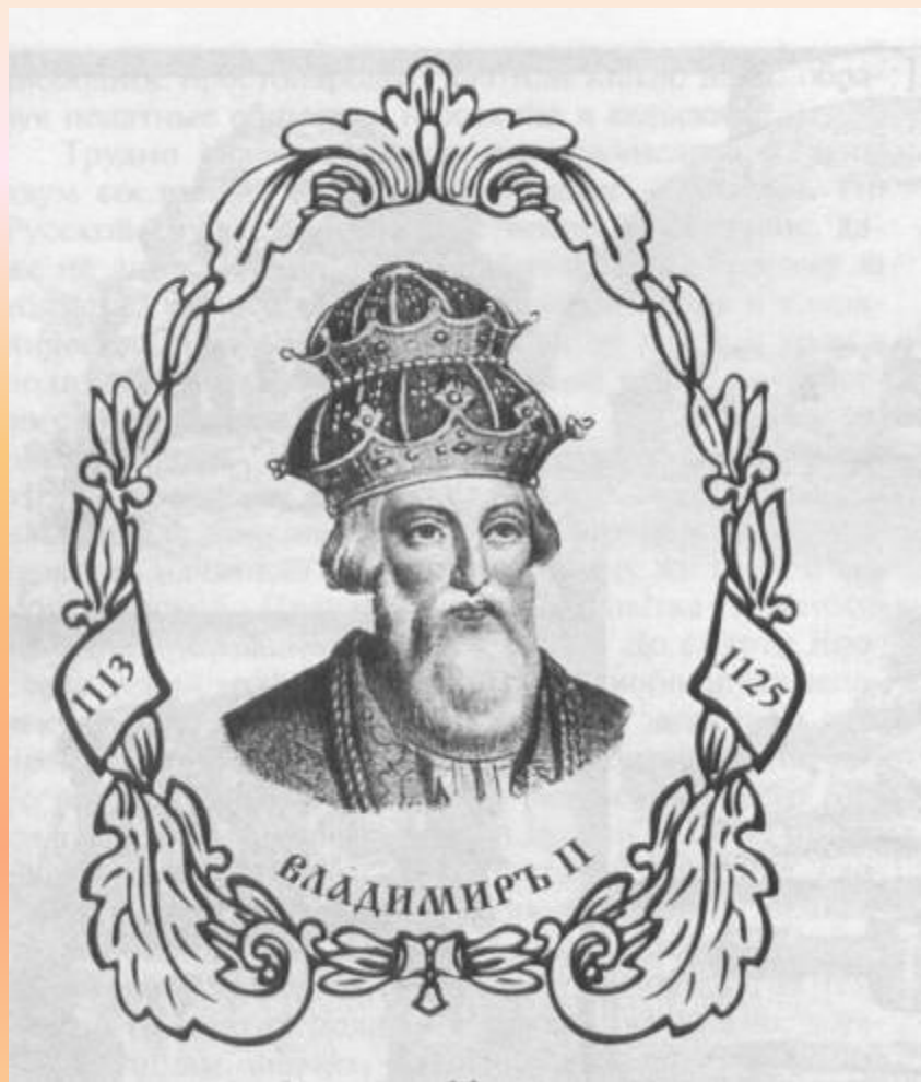
Князь Владимир Мономах

«Что знаете хорошего, того не забывайте; Чего не знаете, тому учитесь, не ленитесь ни на что доброе...»