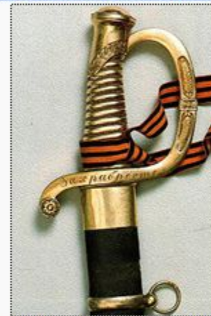
Эфеэ наградной золотой сабли. Хорошо видна надпись «За храбрость» на гарде