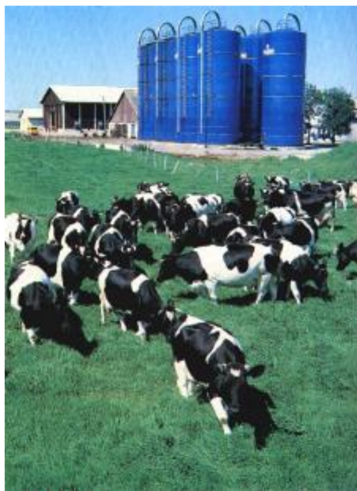
Животноводческий комплекс в Литве.

Бурное промышленное строительство в республиках привело к усилению роли Центра. В 70-е гг. были ликвидированы те права и привилегии, которые республики получили в 50-е гг. Экономическое, социальное и культурное развитие теперь шло под контролем Кремля. Переселение в республики русскоязычных кадров воспринималось там как русская экспансия. Это привело к усилению национализма.