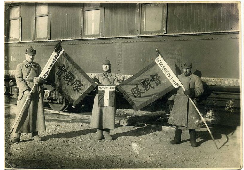
Захваченные китайские знамена

В 1928 г. к власти в Китае пришло правительство Чан Кайши, которое попыталось силой вернуть себе утраченные на КВЖД позиции