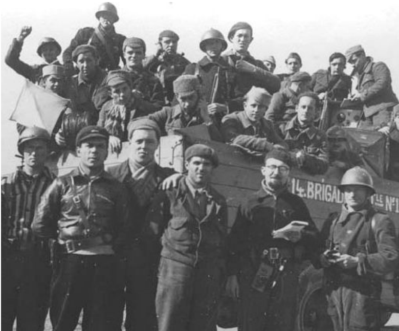
14 интернациональная бригада

В 1939 г. республиканское правительство Испании, сотрясаемое внутренними противоречиями, капитулировало перед мятежниками