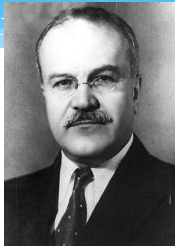
В.М.Молотов(Скрябин), С 1939 г.