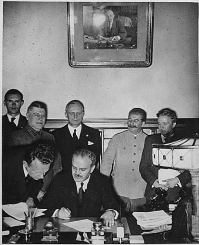
Подписание пакта о ненападении 23 августа 1939 г.