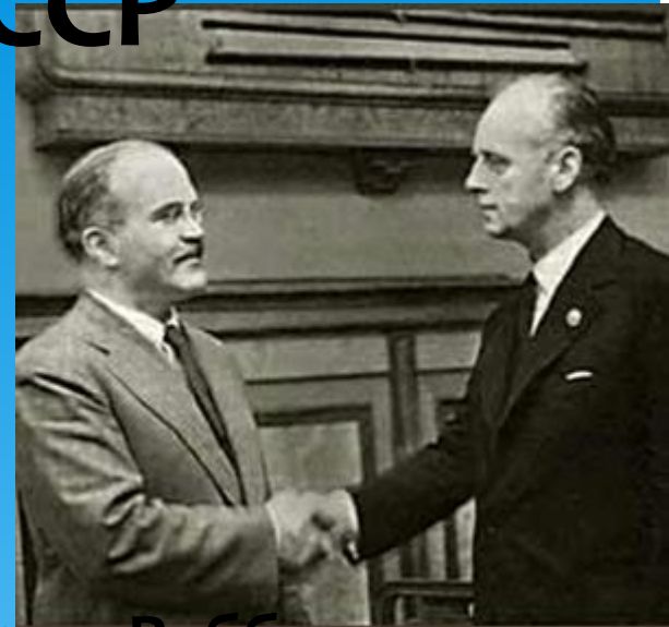
Молотов и Риббентроп