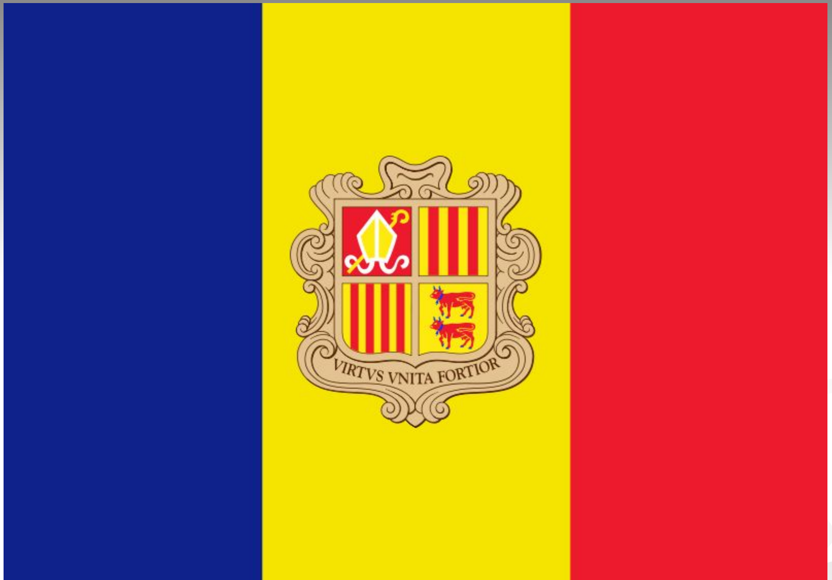
3). Флаг Андорры.