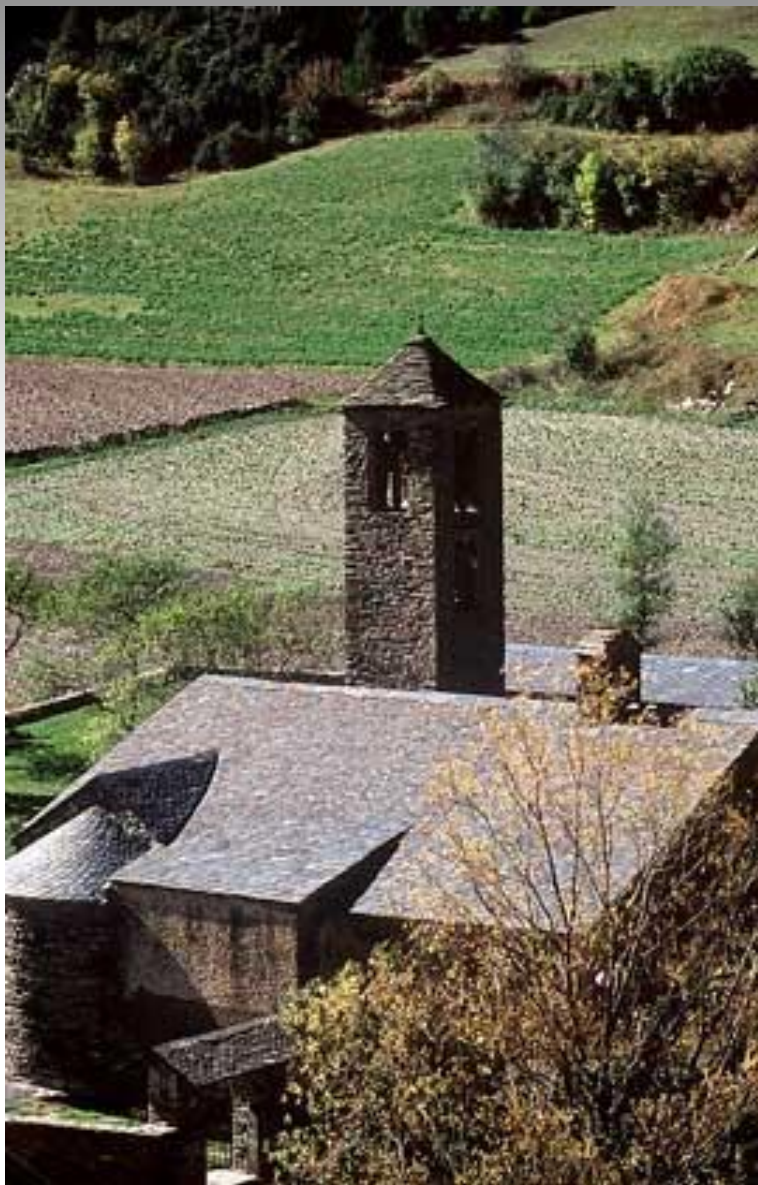
Деревня в Пиренеях.