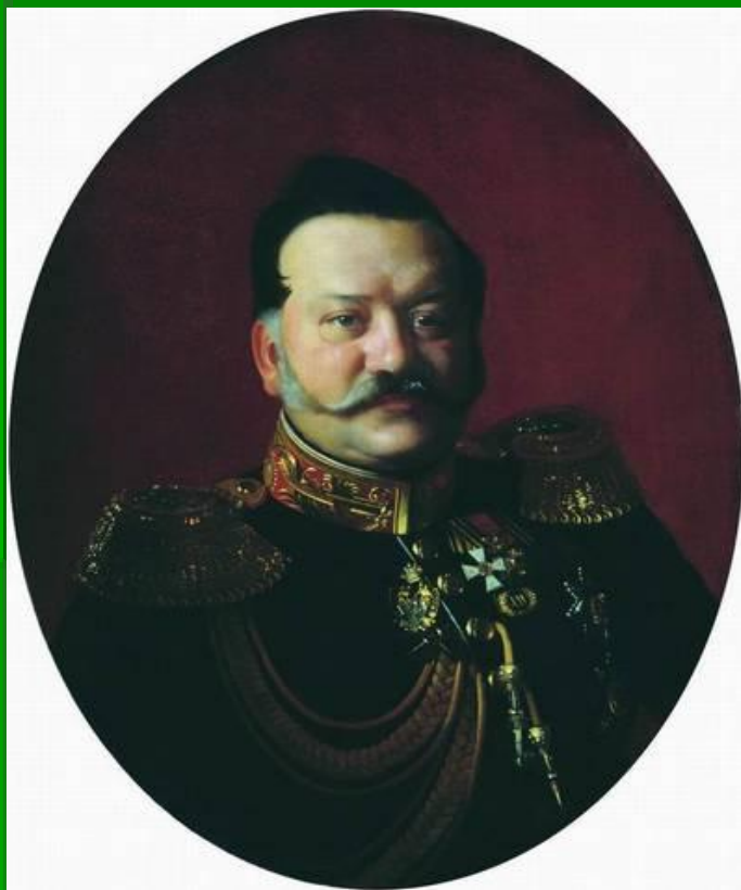
Я.И.Ростовцев, генерал, Член Государственного Совета