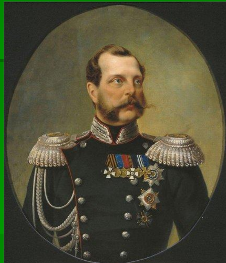
В.И.Назимов, Положивший начало Крестьянской реформе 1861 г