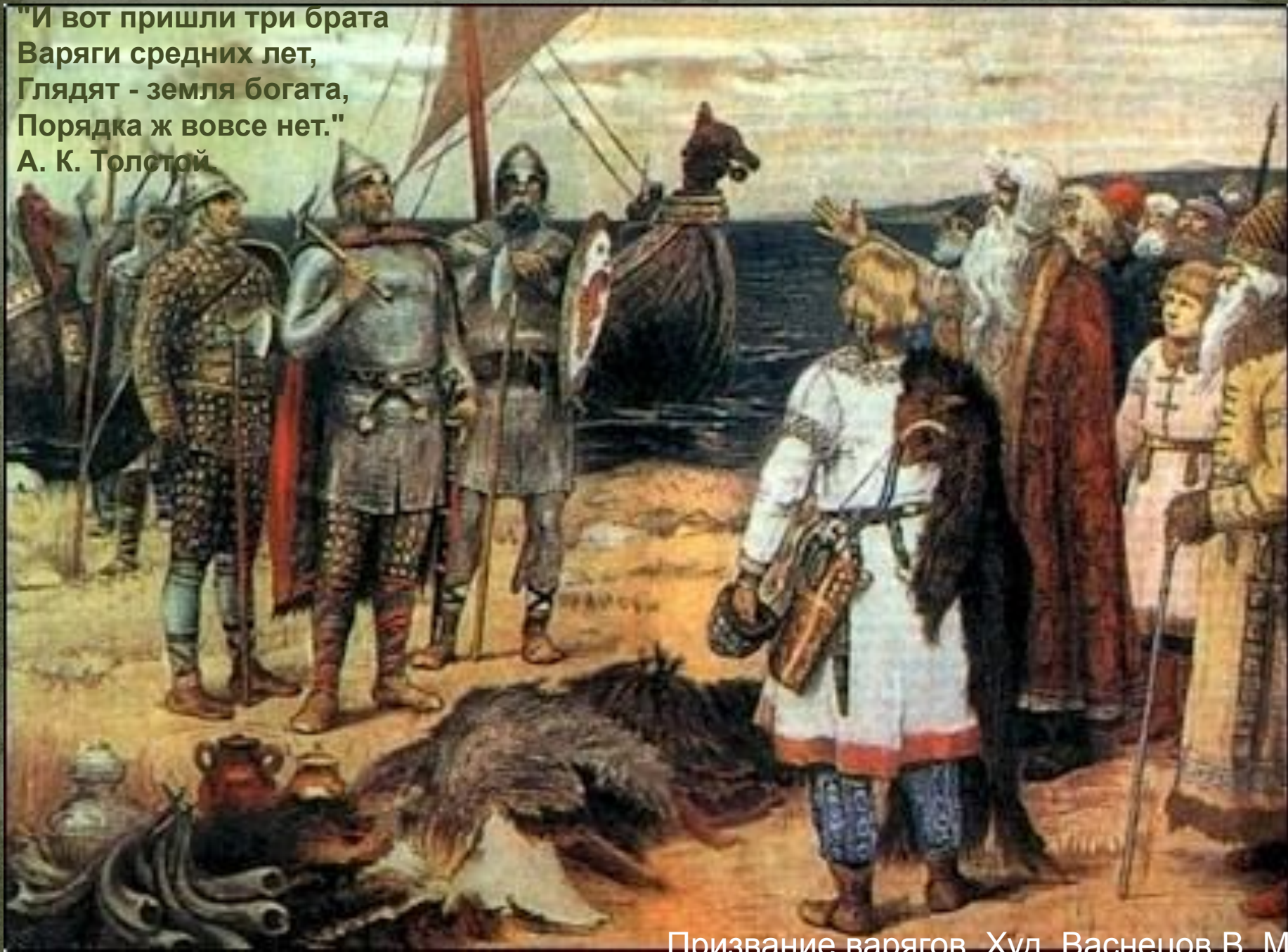
Призвание варягов. Худ. Васнецов В. М.

"И вот пришли три брата Варяги средних лет, Глядят - земля богата, Порядка ж вовсе нет." А. К. Толстой