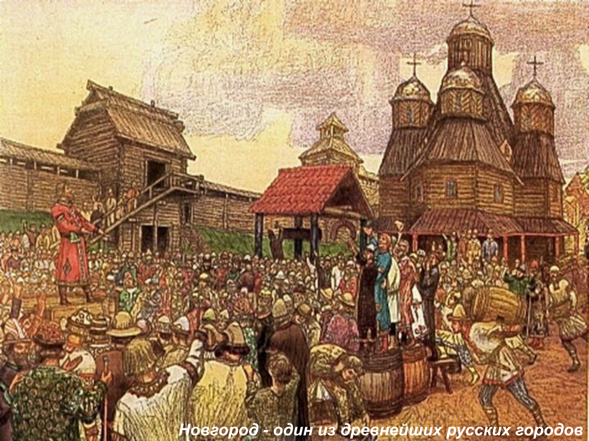
Новгород - один из древнейших русских городов