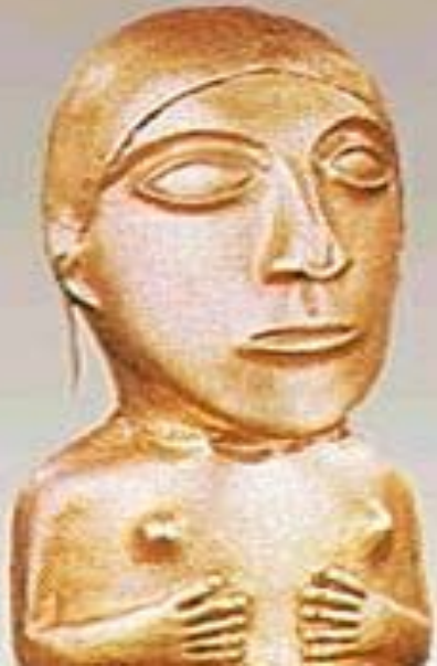
Статуя из золота