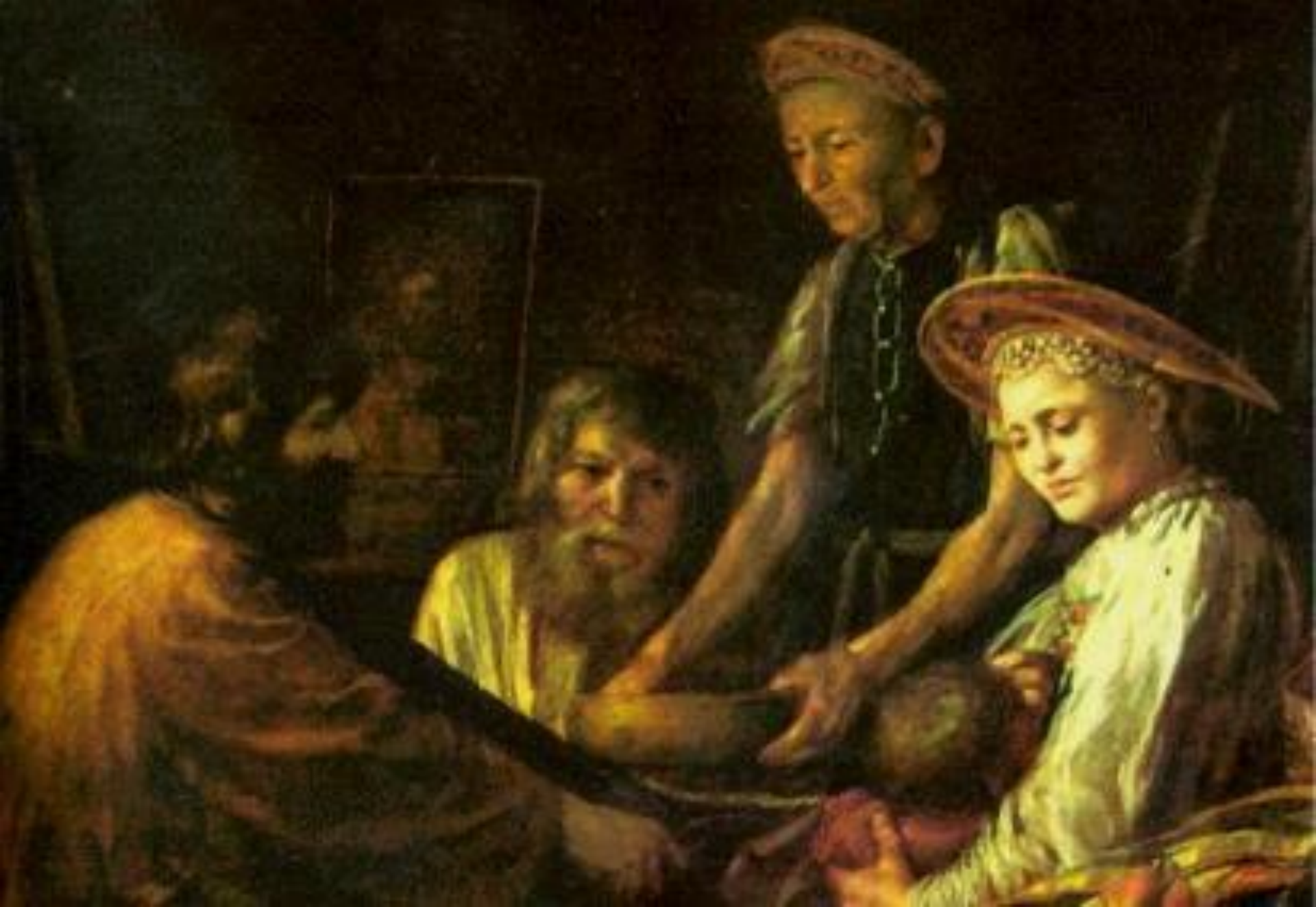
М.Шибанов. Крестьянский обед.