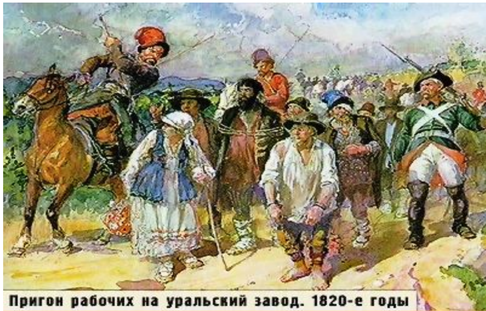
Пригон рабочих на уральский завод. 1820-е годы