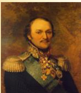
М. И. Платов