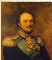
М. И. Платов