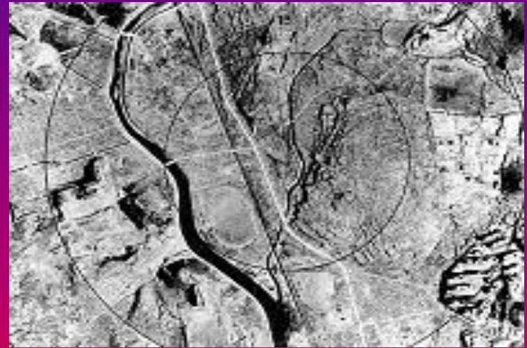
Нагасаки через три дня после взрыва