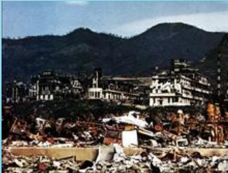
Госпиталь Медицинского колледжа Нагасаки