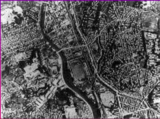
Нагасаки за два дня до взрыва