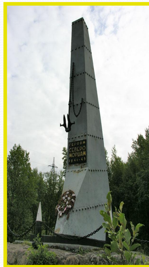
Памятник морякам- североморцам.