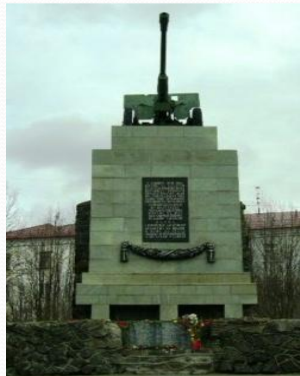
Памятник воинам 6-й Героической комсомольской батареи