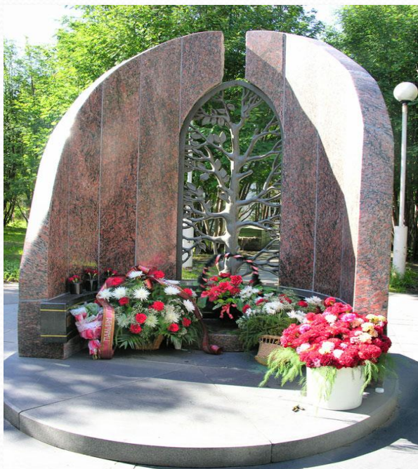
Памятник солдатскому долгу

Памятник боевому сотрудничеству стран антигитлеровской коалиции в годы второй мировой войны.