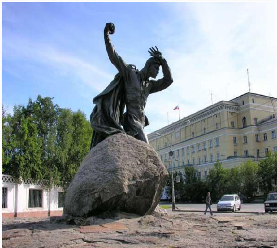
Памятник Анатолию Бребову