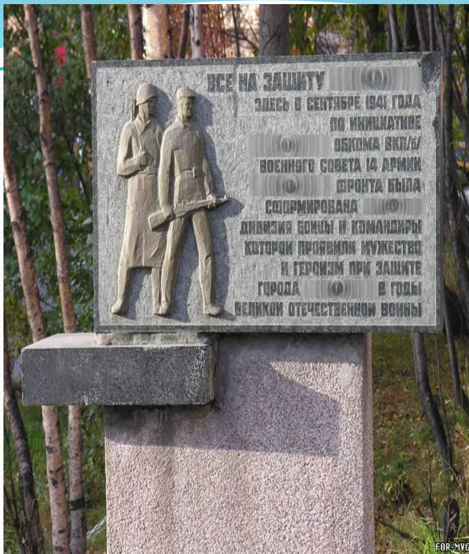
Памятник портовикам, погибшим в годы войны.