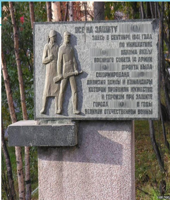
Памятник портовикам, погибшим в годы войны.