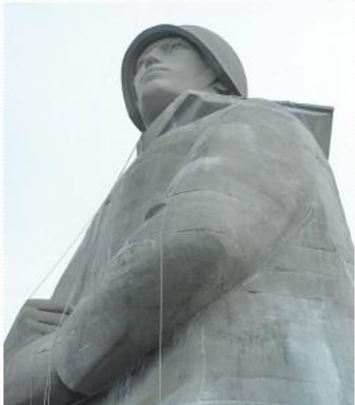
Памятник Защитникам Советского Заполярья в годы Великой Отечественной войны.