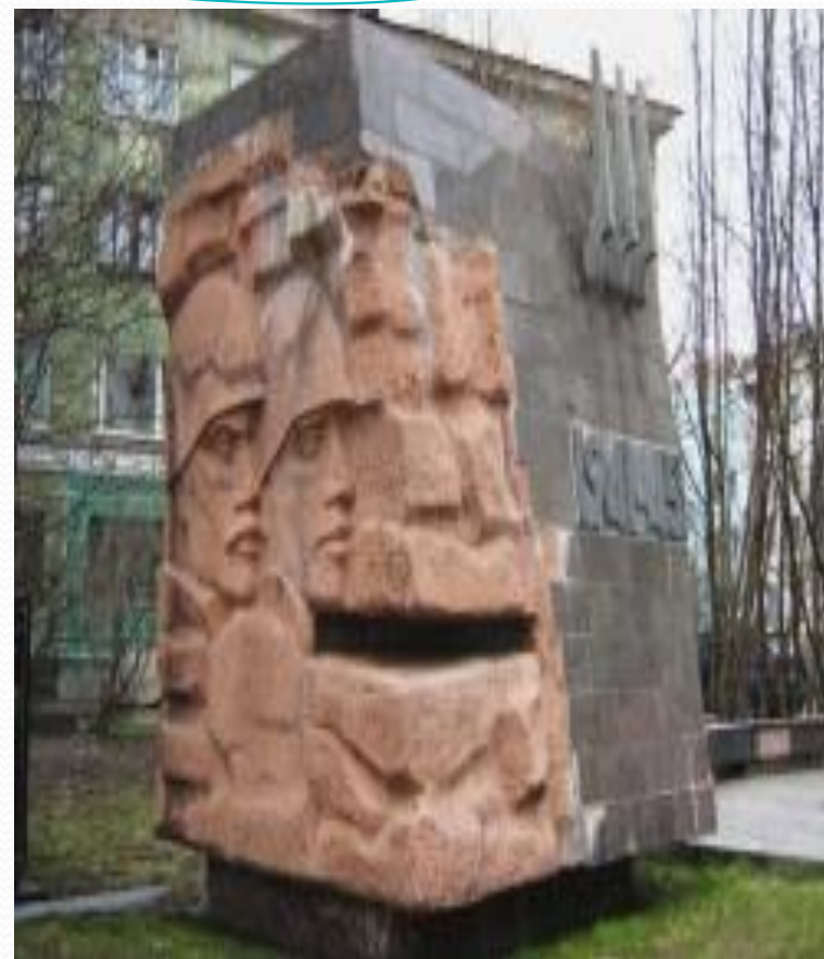
Памятник «Воинам-строителям, защитникам Родины в Великой Отечественной войне 1941-1945»