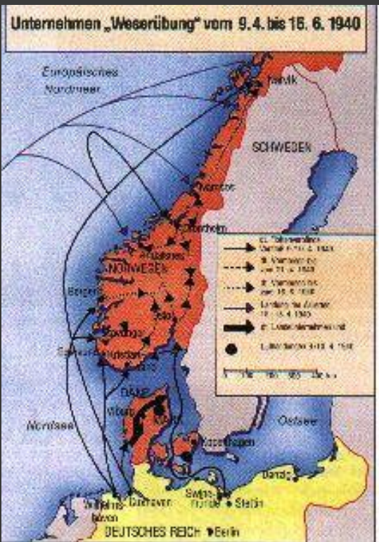
9 апреля 1940 года Нападение Германии на Данию и Норвегию