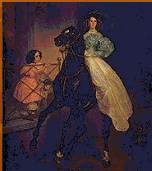
К. П. Брюллов. «Всадница». Портрет Джованины и Амацилии Паччини, воспитаниц гр. Самойловой Ю. П. 1832 г.