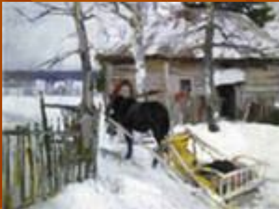
К.А. Коровин . Зимой