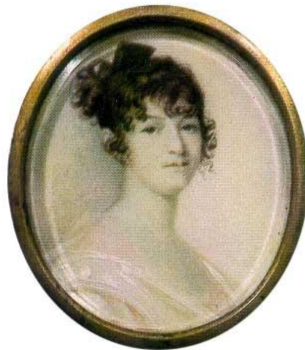
Н.О. Пушкина. 1800-е гг.

Мать, Надежда Осиповна, приходилась внучкой араму Петра I, впоследствии русскому генералу Ганнибалу.