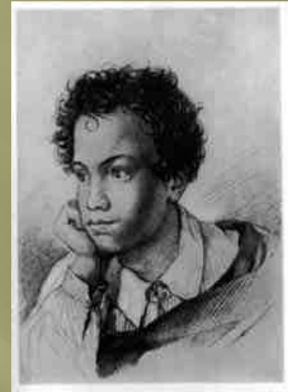
А. С. Пушкин - ученик

Но из всех предметов Саша так и не любил арифметику.