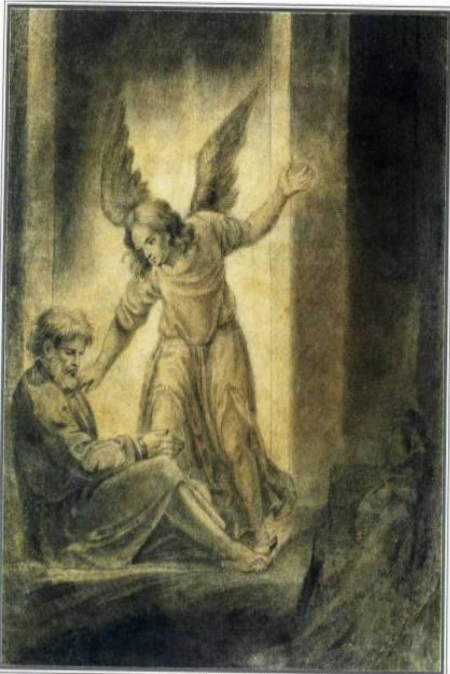
«Сліпа з дочкою» 1842