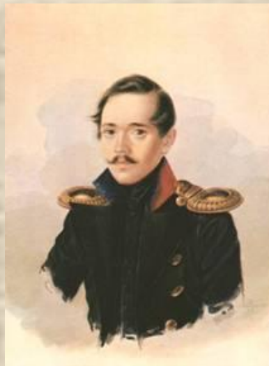
М.Ю.Лермонтов в сюртуке лейб-гвардии Гусарского полка. Акварель А.И.Клюндера.