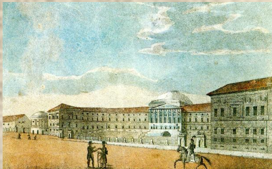
Московский университет. Неизвестный художник. 1820-е