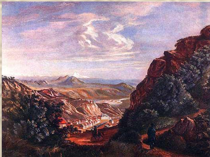
М. Ю. Лермонтов «Вид Пятигорска».

В 1840 году за дуэль с сыном французского посланника де Барантом М. Ю. Лермонтова вновь ссылают на Кавказ.