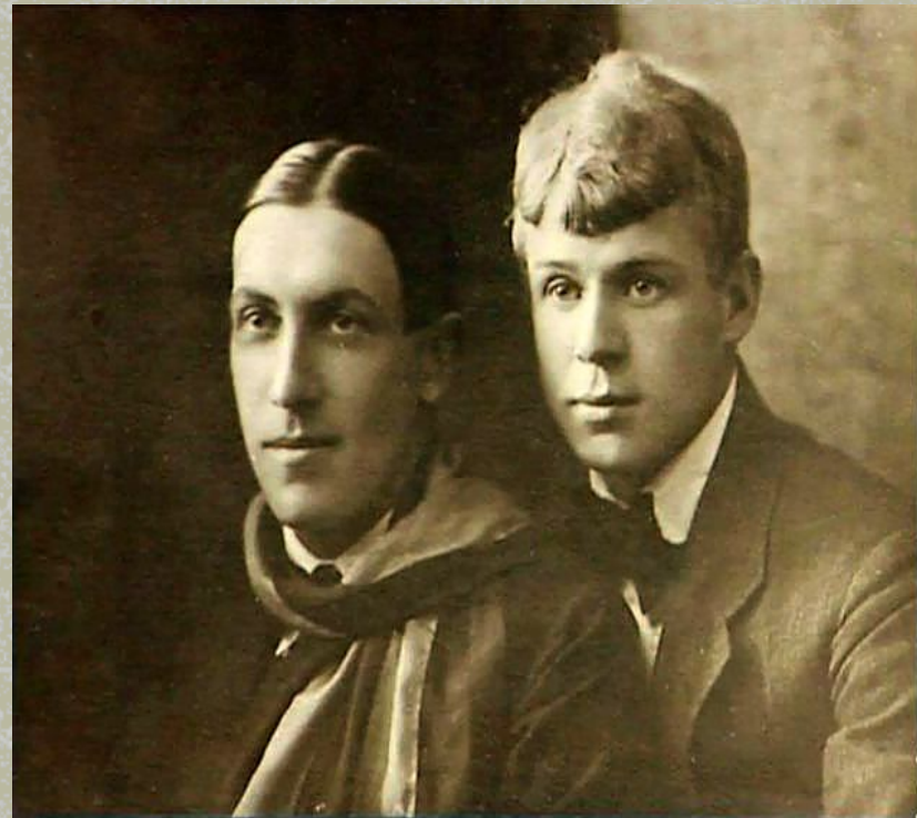
А. Мариенгоф и С. Есенин